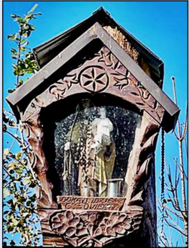
Spisz, Dursztyn