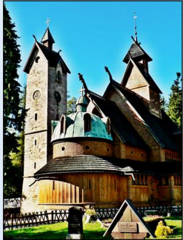
zob. Kościół Górski Naszego Zbawiciela (WANG)