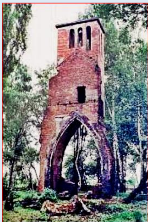
Ruiny miejskiego krematorium na Cmentarzu Centralnym, lata 90. XX wieku. Domena publiczna.