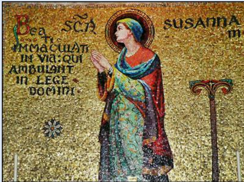
1. USA – Waszyngton, moz. w baz. Niepokal. Poczęcia NMP; P1270313- 30.IX.'08

Jeżeli nie zaznaczono inaczej, to zdjęcia: Jan Nitecki