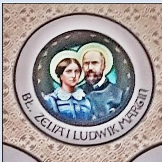
Ruda Śląska-Orzegów, ko. św. Michała Archaniola