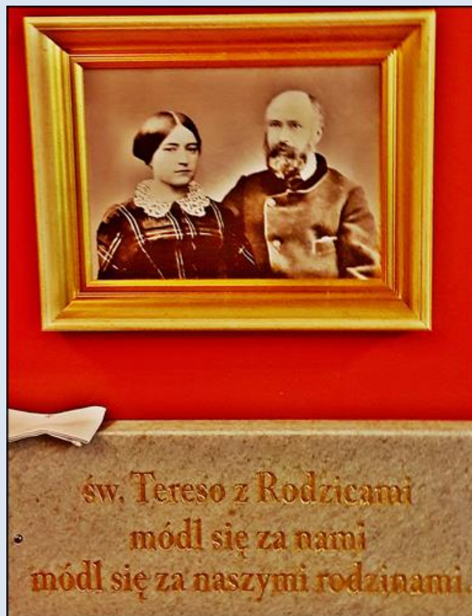
Piekary Śląskie-Brzeziny, ko. NSPJ