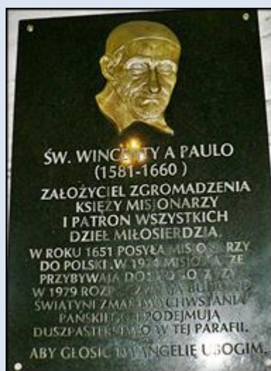
24. Bydgoszcz, fg w baz. św. Wincentego a Paulo;