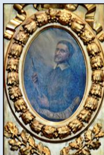
25. Bydgoszcz, pł. w ko Zmartwychwstania Pańskiego;