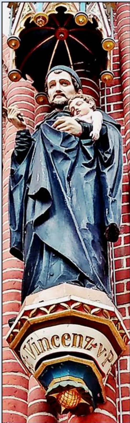
Wrocław, Kościół pw. św. Michała Archanioła