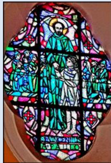
W9,31- Zakopane- Olcza, ob. w Sankt. MB; Katowice-Nikiszowiec, ko. św. Anny (zdz. pw)