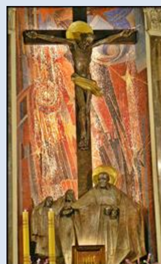
22. Sopot, POM, pł. w ko Zesłania Ducha Św.