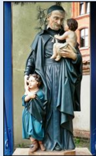
10. Kraków, fg w ko św. Wincentego a Paulo; 11. Kraków, pł. w ko św. Wincentego a Paulo; 12. Chełmno, KPM, fg w ko śś. Jana Ap. i Jana Chrzczi.;