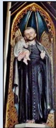
13. Trzebnica, DLN, fg w baz. – Sankt. św. Jadwigi Śląskiej; 14. Gidle, ŁDZ, wt w baz. – Sankt. MB Gidelskiej; 15. Bystrzyca Kłodzka, fg w ko św. Michała Arch.;