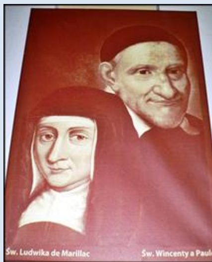
19. Zakopane- Olcza, fg2 k. ko NMP Objaw. Cudowny Med.