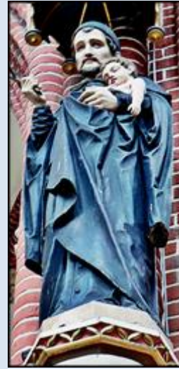
28. Włocławek, ob. w Muz. Diecez.