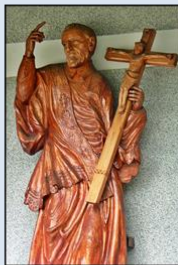
16. Olsztyn, fg w baz. św. Jakuba Ap.; 17. Zakopane- Olcza, ob. w ko NMP Objaw. Cudowny Med. 18. „ fg k. ko „