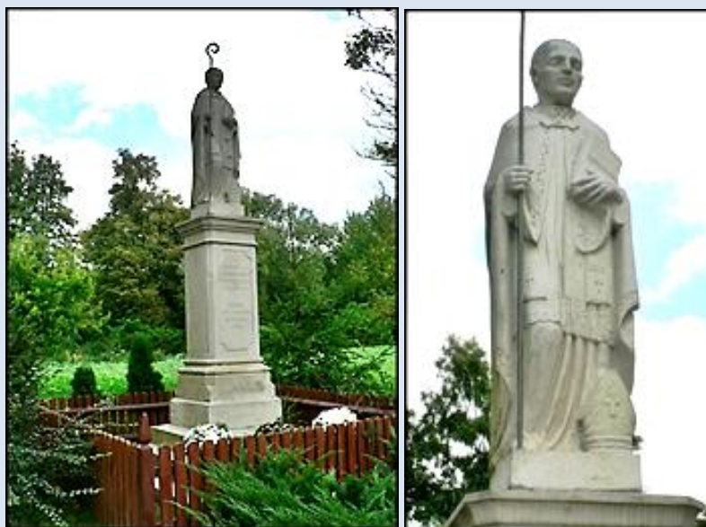
8. Karwów, ŚWK, fg z 1919 r. przyd.;