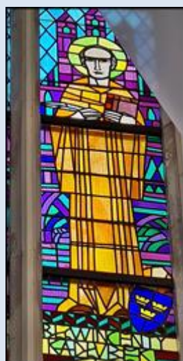
Oświęcim, Sankt. MB Wspomożenia Wiernych (zdz. pw)