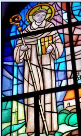
4. Warszawa, fg na fasadzie ko św. Marcina;