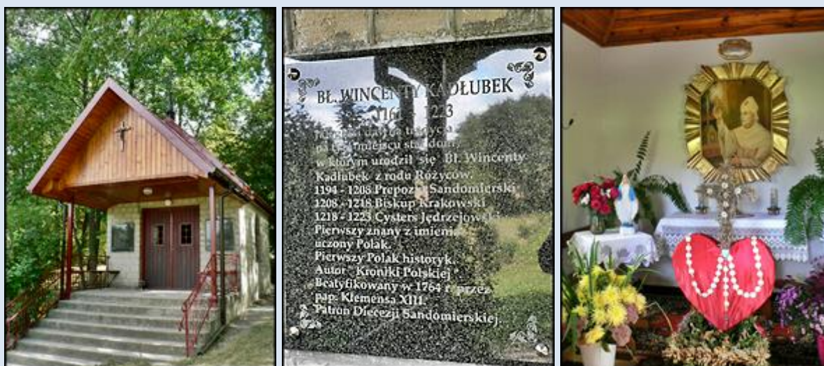
9. Karwów, ŚWK, ob. w kd przyd.;