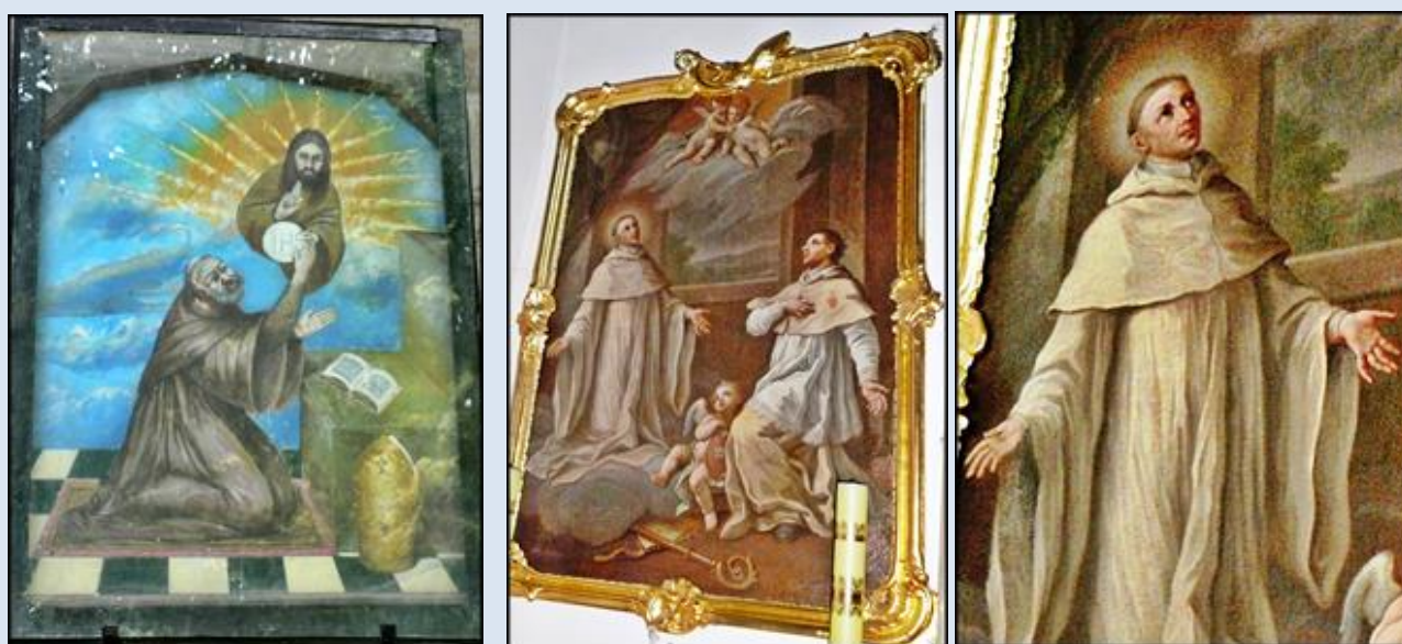
10. Karwów, ŚWK, ob. 2 w kd przyd.;