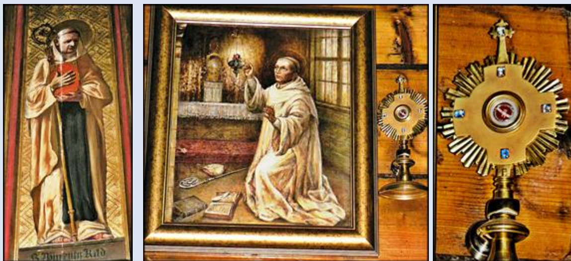
12. Kraków, ob. w ko św. Katarzyny Al.; 13. Brzegi, MAŁ, ob. i rel. w ko św. Antoniego; P2220891,2- 16.VI.'15.