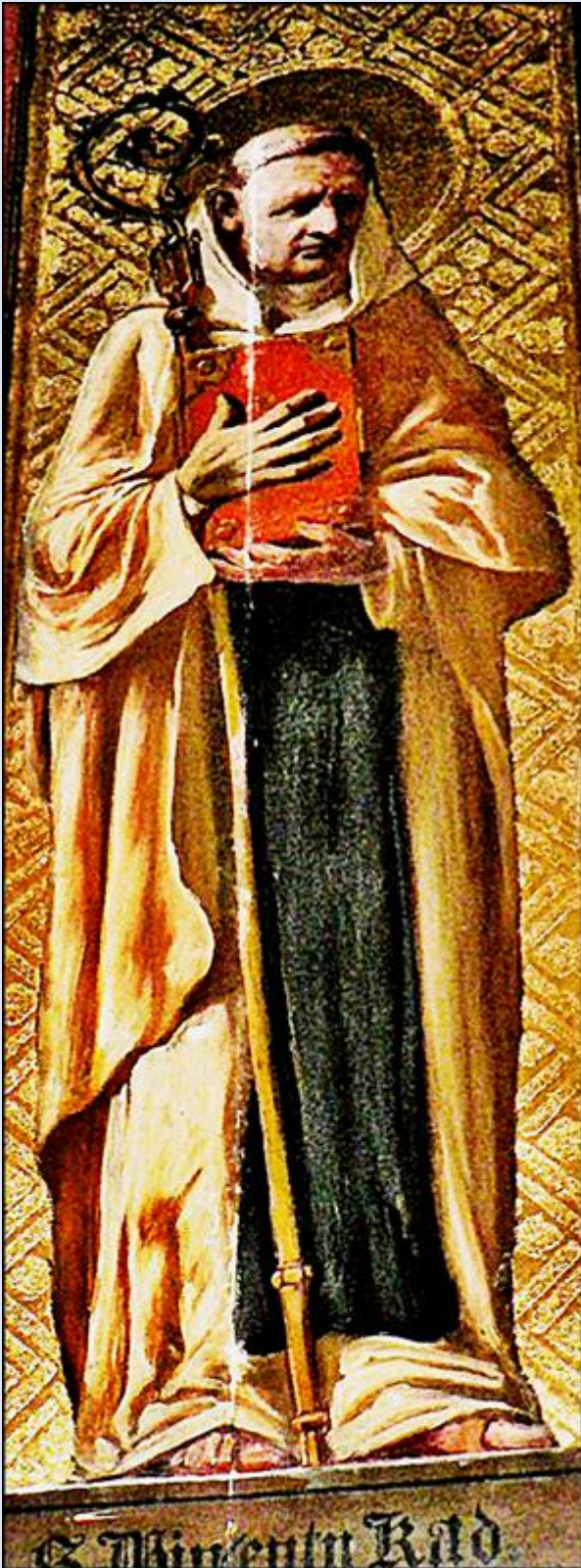
Kraków, ob. w ko św. Katarzyny Aleksandryjskiej