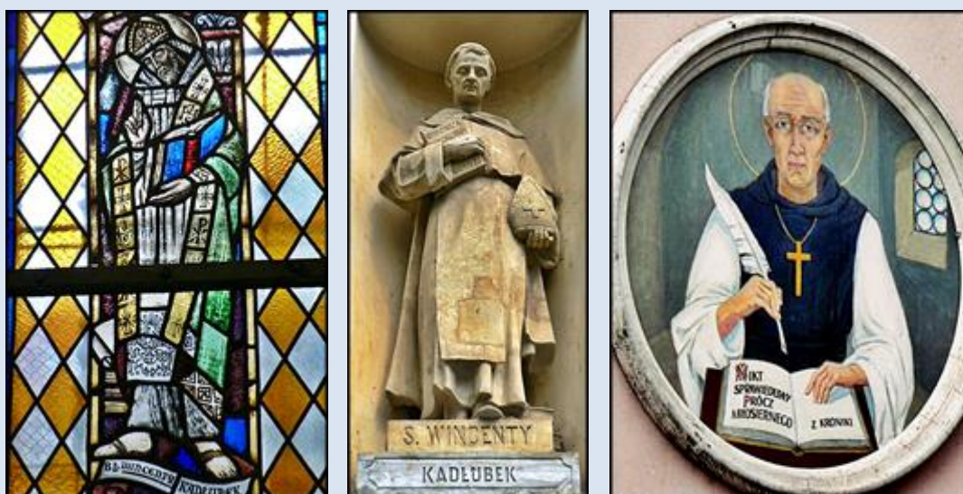
14. Gdańsk- Wrzeszcz, wt w ko NSPJ; 15. Warszawa, fg w ko św. Karola Boromeusza; W8,16- Kraków- Nowa Huta, ob. na budynku Księgarni im. W.K.