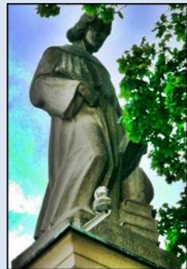
5. Skarżysko Kamienna, wt w Sankt. MB Ostrobramskiej;