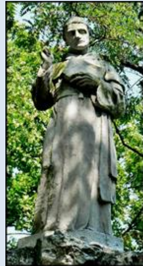
1. Jędrzejów, ŚWK, fg z 1917 r. k. klasztoru cystersów;