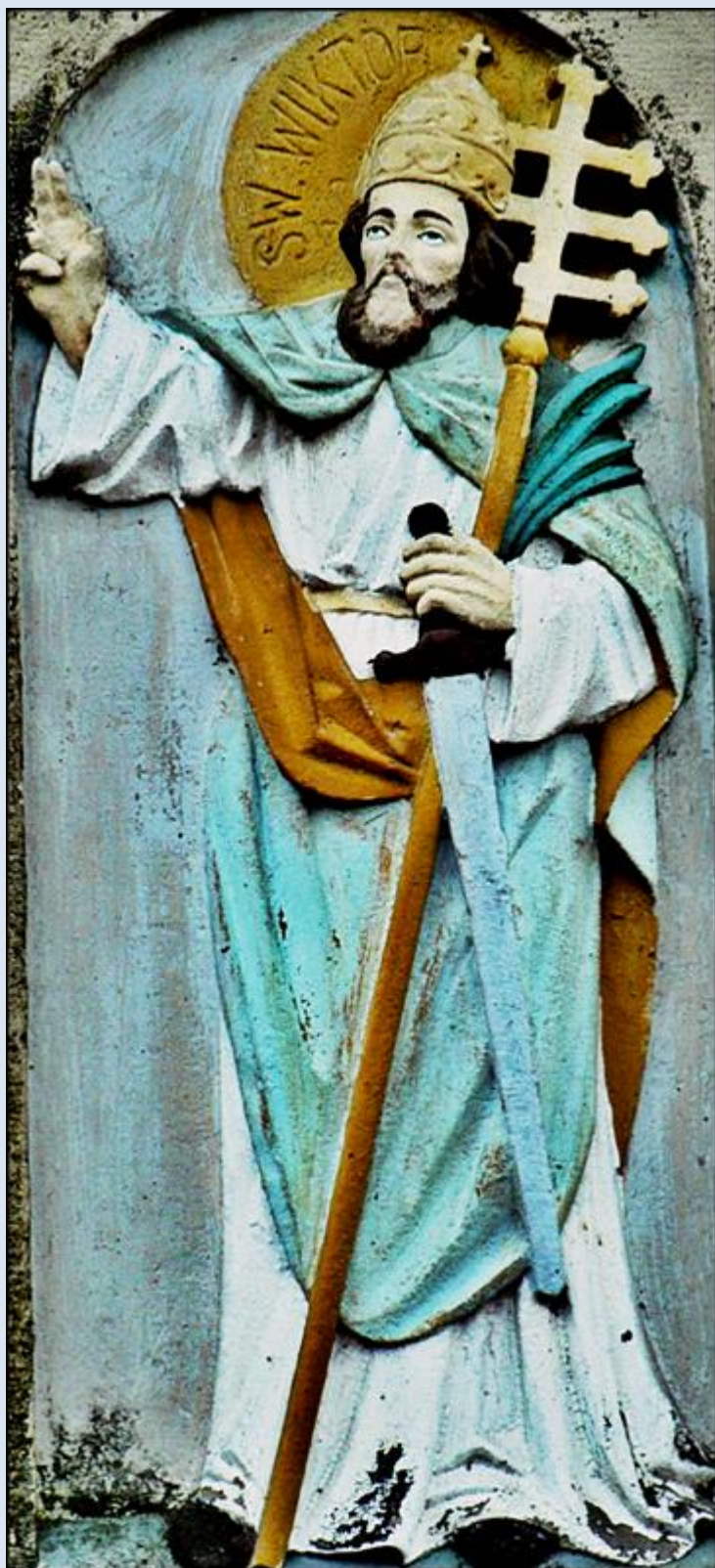
Łoniowa, MAŁ, pł. na fg Piety z 1916 r.

zobacz: Święci w Polsce i ich kult w świetle historii http://www.sancti-in-polonia.wietrzykowski.net/2j.html http://www.sancti-in-polonia.wietrzykowski.net/7j.html