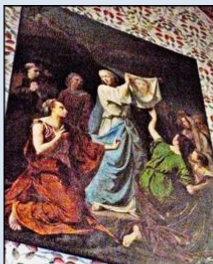
21. Szczucin, MAŁ, fg w kd k. ko paraf.; W4,22- Koziegłówek, ob. w ko św. Antoniego;