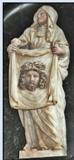
W4,33. Warszawa, ob. (DK) w ko św. Andrzeja Boboli na Saskiej Kępie; W4,34. Gdańsk – Oliwa, pł. w baz. Św. Trójcy;