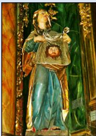
14. Kraków, ob. w baz. św. Franciszka;