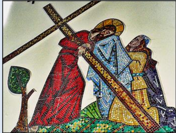
W4,39. Toruń, ob. w Muzeum Regional.