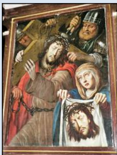
6. Rzym, fg w baz. św. Piotra; P1800090- 29.03.'12.