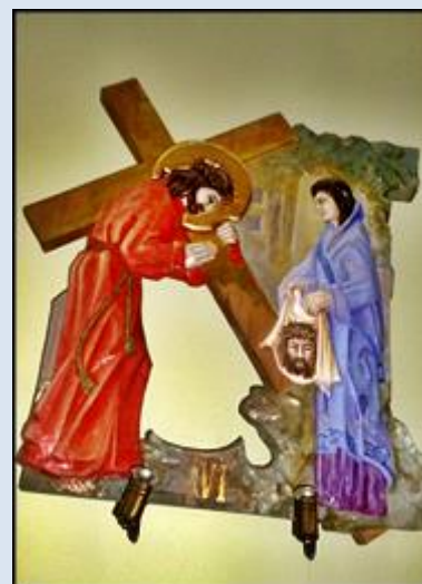
18. Dąbrowa Górnicza, ob. w baz. MB Anielskiej; 19. Krynica, MAŁ, wt w ko św. Antoniego; 20. Częstochowa, pł. DK w ko św. Wojciecha;