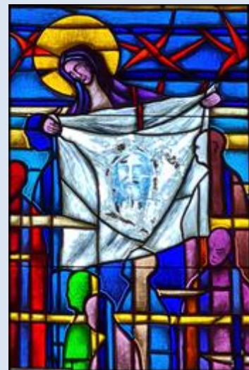
W4,44- Toruń, wt w ko Chrystusa Króla;