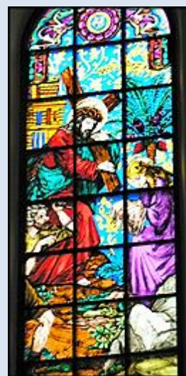
15. Kraków, fg w baz. Nawiedzenia NMP; 16. Miechów, fg w baz. – Sankt. Grobu Bożego; 17. Domaniewice, ŁDZ, wt w ko św. Wojciecha;