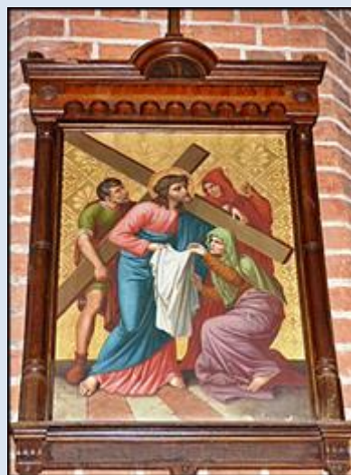
W4,23- Kwidzyn, ob. w ko św. Wojciecha; W4,24- Elbląg, ob. w ko św. Mikołaja;