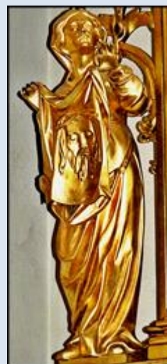
W4,25- Poznań, pł. w baz. śś. Stanisława BM i M. Magdaleny;