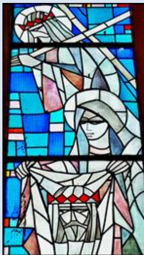
W4,43. Mysłowice, pł. DK w ko NSPJ;