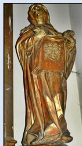
7. Gdańsk – Oliwa, ob. w baz. Św. Krzyża;