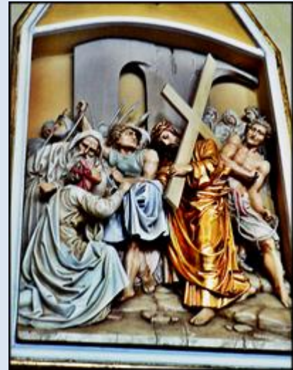
W4,41. Popów, ŚLS, wt w ko św. Józefa;