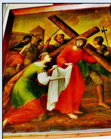
W4,37. Żyrardów, ob. DK w ko św. Karola Boromeusza; W4,38. Głogów, ob. DK w ko Bożego Ciała;