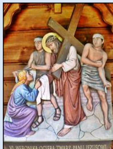
W4,28- Kraków, ob. w ko Niepokal. Poczęcia NMP;