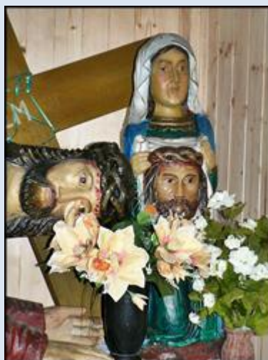
1. Bardo, DLN, fg w baz. – Sankt. MB;