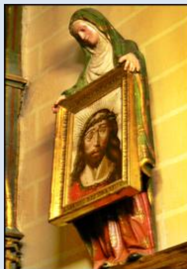
10. Sopot, ob. w ko św. Jerzego- DK VI (garnizon.); 11. Hiszpania -Toledo , fg w kt Primada; P1870419- 9.VII.'12;