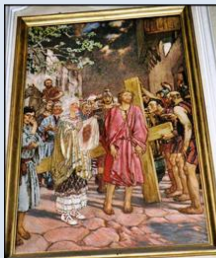
12. Zagórz, PDK, fg na DK k. ruin klasztoru; 13. Kraków, fg w baz. św. Anny;