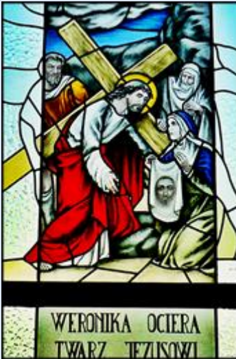
W4,40. Garnek, ŚLS, moz. w ko paraf.;