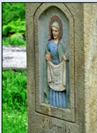
3. Radomsko, pł. w km nadrzewnej przy ul. Jałowcowej; [brak]