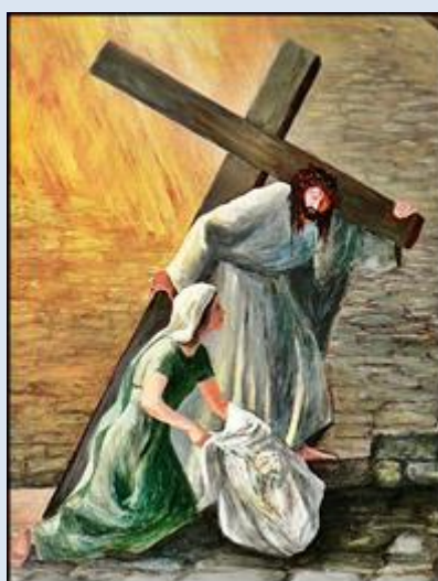
W4,31- Trybusz, MAŁ, fg w ko św. Elżbiety Węg.;