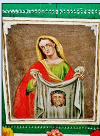
W4,30- Czarna Góra – Zagóra, MAŁ, pł. DK k. ko Przemienienia Pańskiego;