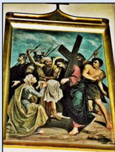
W4,27- Kraków, fg w baz. św. Floriana;