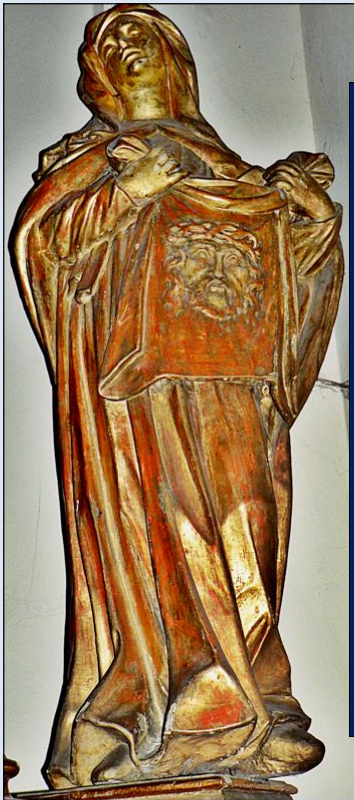
Piotrków Trybunalski, fg w ko św. Franciszka Ksawerego