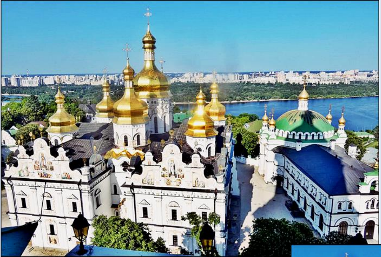
z lewej: Prawosławny klasztor Ławra Peczerska (widok z Wielkiej Dzwonnicy) z prawej: Cerkiew pw. śś. Antoniego i Teodozjusza Pieczerskich