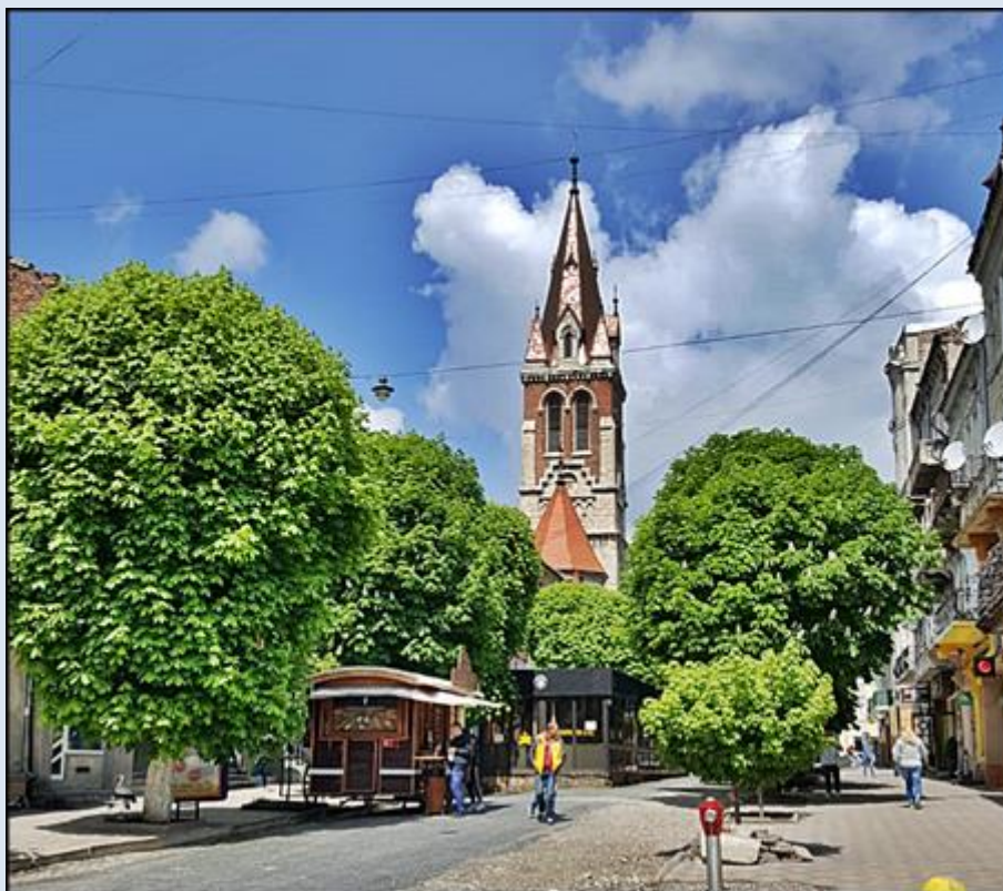
Widok od strony południowej