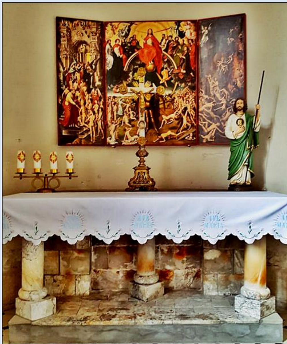
Wnęka lewej nawy. Św. Juda Tadeusz.