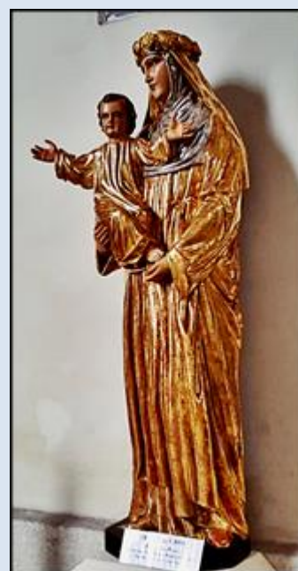
MB Fatimska - Obraz Patrona Kościoła św. Stanisława Bpa i Męczennika - św. Róża z Limy