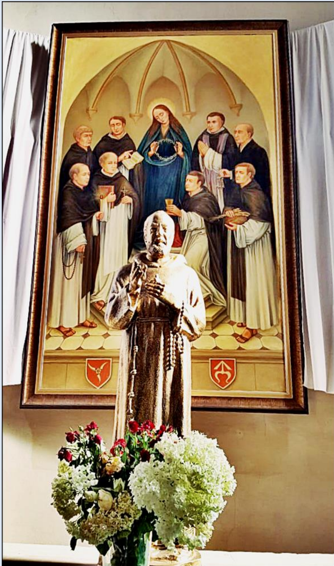
Figura o. Pio w lewej kaplicy (1.08.2023)