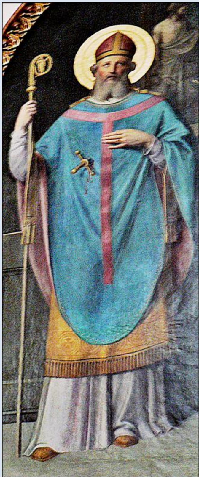
Racibórz, ob. w kp zamkowej św. Tomasza Becketa