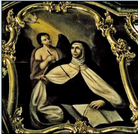
15. Nowy Targ, fg w ko św. Katarzyny Al.;