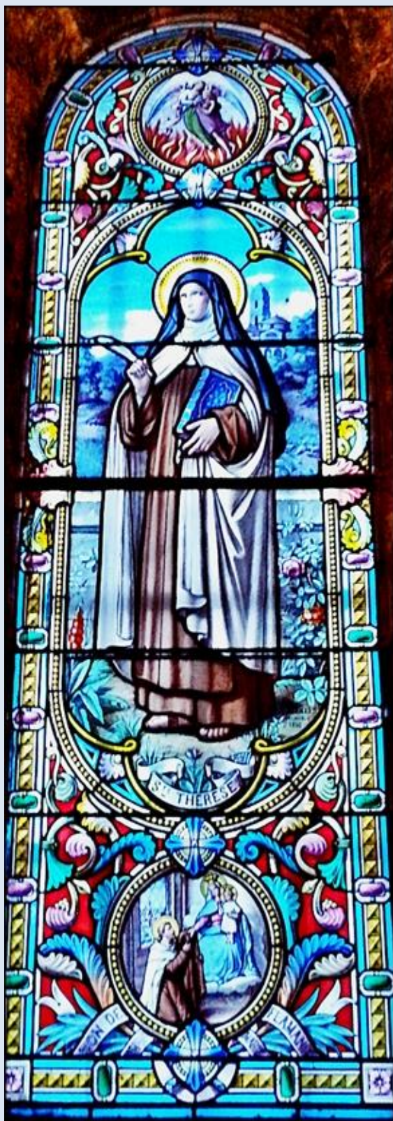
Francja – La Salette, witraż w Baz. MB