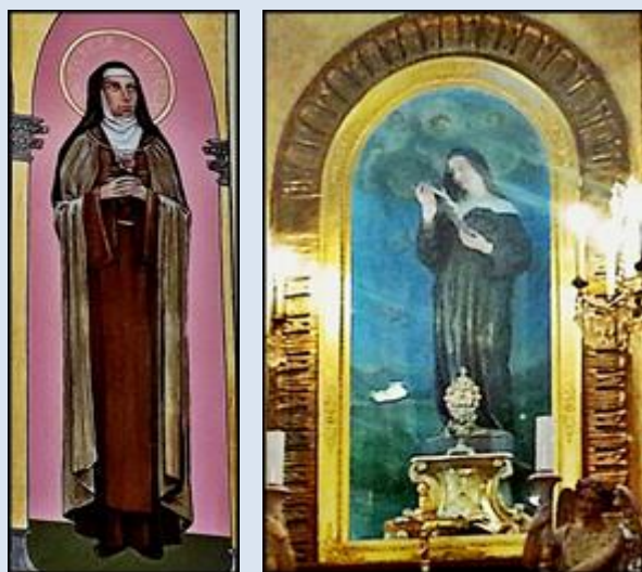
Bytom, ko. Świętej Trójcy (zdj. tsw) Francja, Nicea (zdj. tsw)

Jeżeli nie zaznaczono inaczej, to zdjęcia: Jan Nitecki