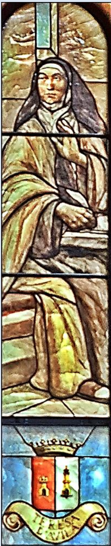
Oświęcim, Ko. św. Józefa Robotnika