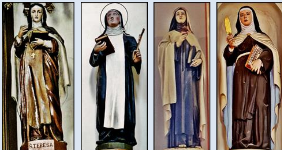
T7,20- Żyrardów, MAZ, w ko MB Pocieszenia; T7,21- Racibórz, fg w kp św. Tomasza Becketa Zabrze, ko. św. Andrzeja Katowice-Józefowiec, ko. Józefa Robotnika