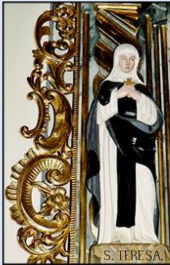
14. Poronin, rel. na Plebani ko św. M. Magdaleny;