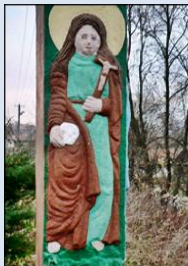
10. Czerna, MAŁ, pł. na bramie klasztoru karmelitów; 11. Doły, MAŁ, pł. na kd przyd.;