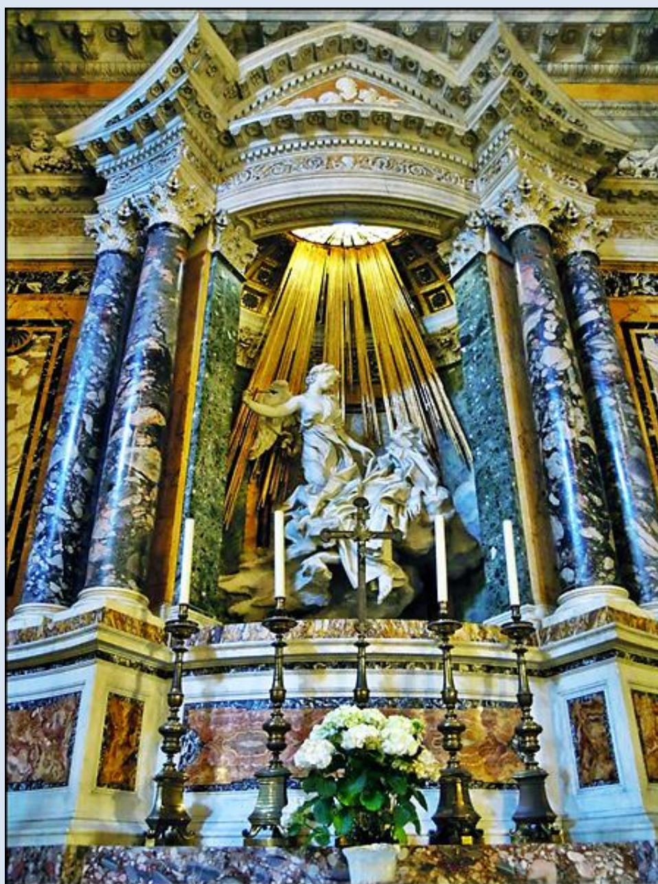
Włochy, Rzym, Kościół Santa Maria della Vittoria