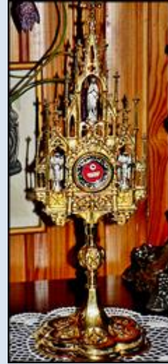
12. Kraków, fg w ko Niepokal. Poczęcia NMP;