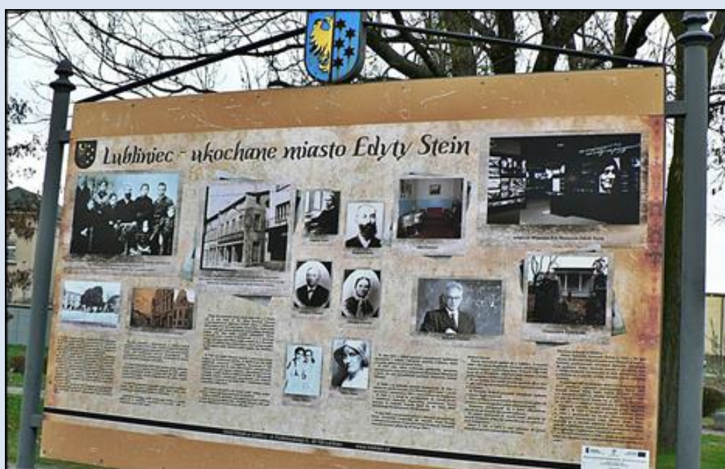
7. Lubliniec, ŚLS, tablica k. ko drew. pw. Św. Krzyża;