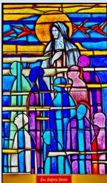
Olesno, ko. Bożego Ciała (zdz. pw)