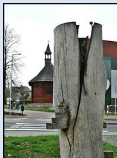
8. Lubliniec, ŚLS, pk pamięci Edyty Stein na Skwerze Rodziny Stein;