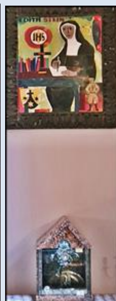
Brzezinka, Ko. MB Królowej Polski (zdz. pw)