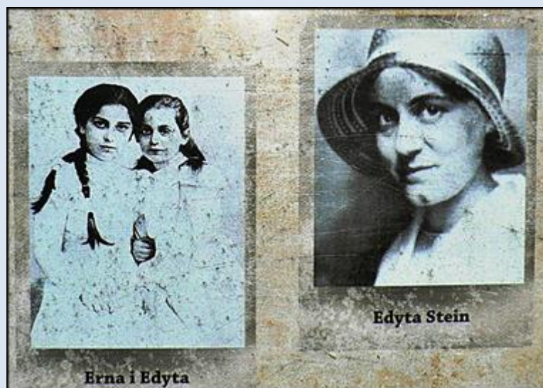
7. Lubliniec, ŚLS, kopia zdj. na tablicy k. ko drew. pw. Św. Krzyża;