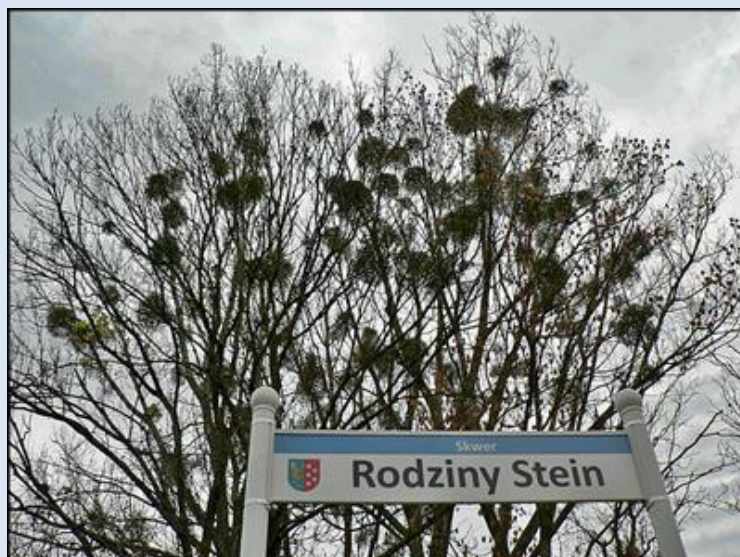
8. Lubliniec, SLS, Skwer Rodziny Stein