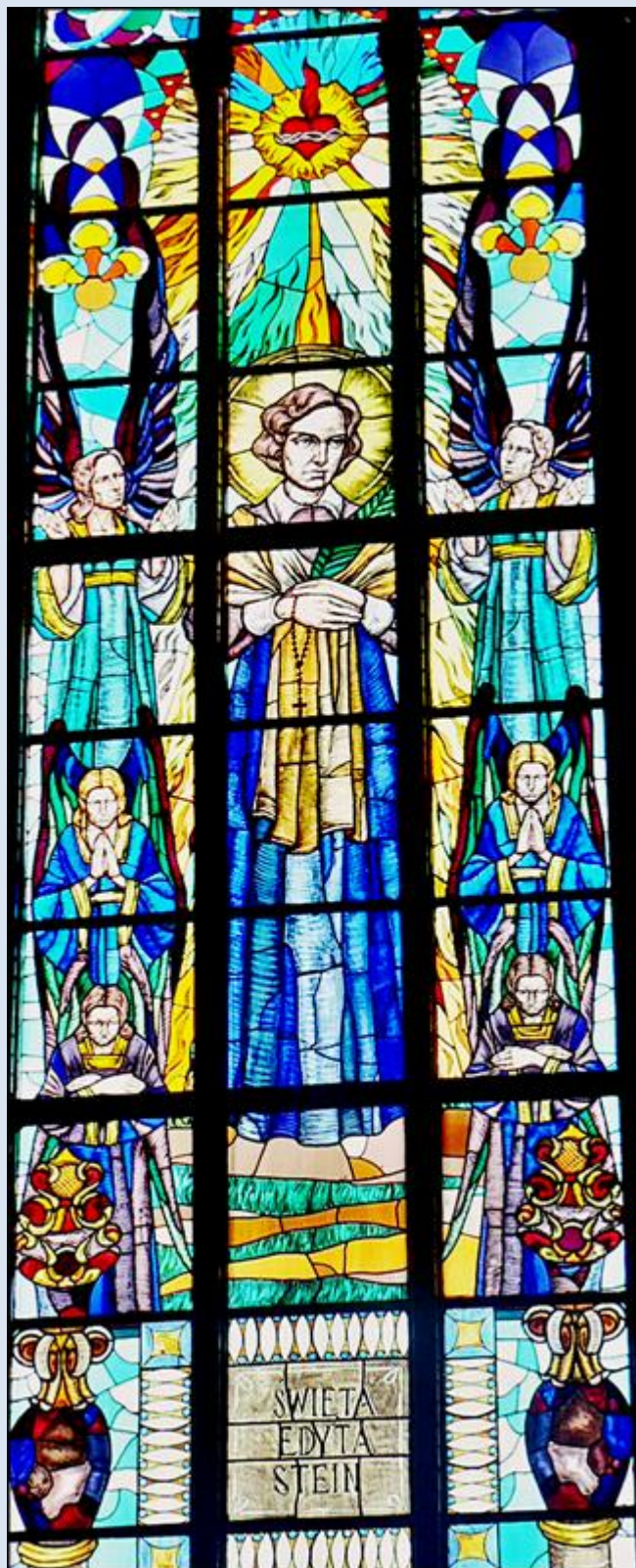
Rybnik, ŚLS, wt w baz. Św. Antonieg