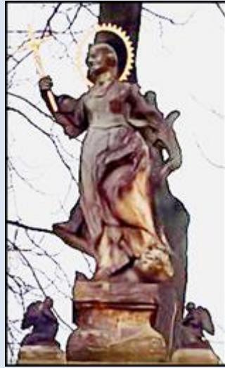
T1,20- Rzeszów, ob. w ko śś. Wojciecha i Stanisława; Kielce, skwerek przy Rynku

Jeżeli nie zaznaczono inaczej, to zdjęcia: Jan Nitecki