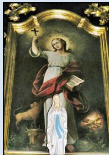
10. Rzym, fg w baz. śś. Ambrożego i Karola; 11. Warszawa, ob. w ko WNMP; 12. Wieruszów, ob. w ko Zesłania Ducha Św.;