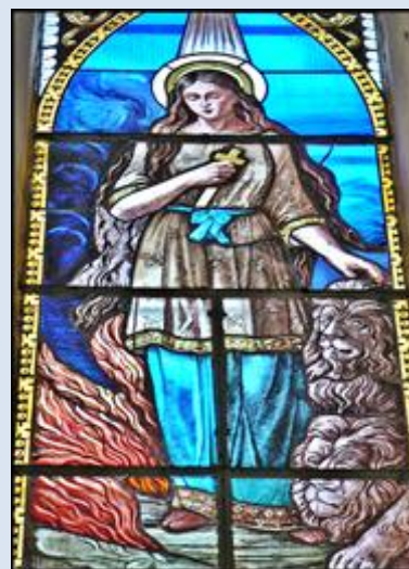
T1,16- Strzelce Wlk, ŁDZ, ko Opatrzności Bożej; T1,17- Przedbórz, ŁDZ, fg w ko św. Aleksego; T1,18- Niedośpielin, fg w ko św. Katarzyny Al. T1,19- Ciechocinek, wt w ko św. Ap. Piotra i Pawła