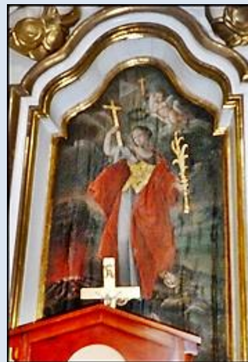
13. Kraków, fg w baz. śś. Michała Arch. i Stanisława; 14. Mstów, ob. w ko WNMP; 15. Janów Lubelski, ob. w ko św. Jana Chrzcici.