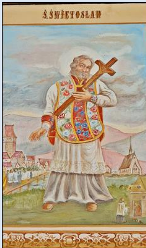
S43,2- Kraków, ob. w ko św. Katarzyny Al. Sławków, na ścianie CARITAS-u, (zdj. pw)

Jeżeli nie zaznaczono inaczej, to zdjęcia: Jan Nitecki