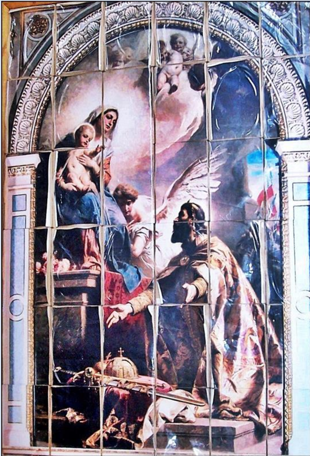
Węgry, Budapeszt, Katedra pw. św. Stefana

zobacz: Święci w Polsce i ich kult w świetle historii http://sancti-in-polonia.wietrzykowski.net/2s.html