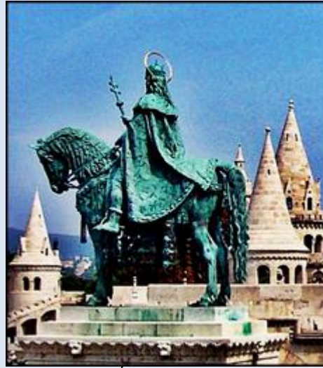
S20,13- Gdańsk- Oliwa, fg w baz. Św. Trójcy; Węgry, Budapeszt, przy Katedrze św. Stefana