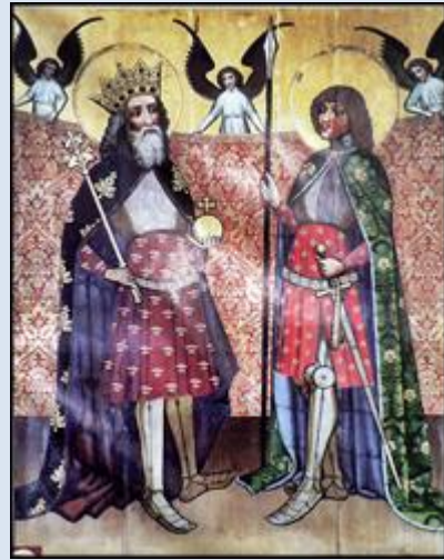
4. Rzym, ob. w ko S. Maria dell Am.; 1800628- 30.III.'12.