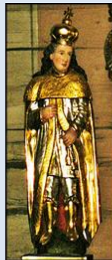
S20,10-Wielgomłyny, ŁDZ, fg w ko św. Stanisława BM;