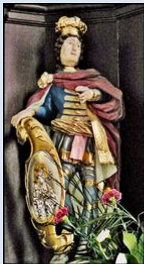
9. Kraków, fg w ko św. Kazimierza (reformatorów);