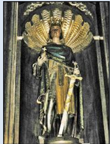
7. Francja – Lourdes, kop. ob. w baz. św. Piusa X;