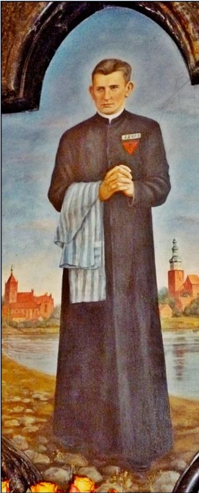
Chelmża, KPM, ob. w Kościele pw. Św. Trójcy

Ksiądz, harcerz, męczennik, patron harcerstwa, całym życiem służył Bogu, Polsce i bliźnim.