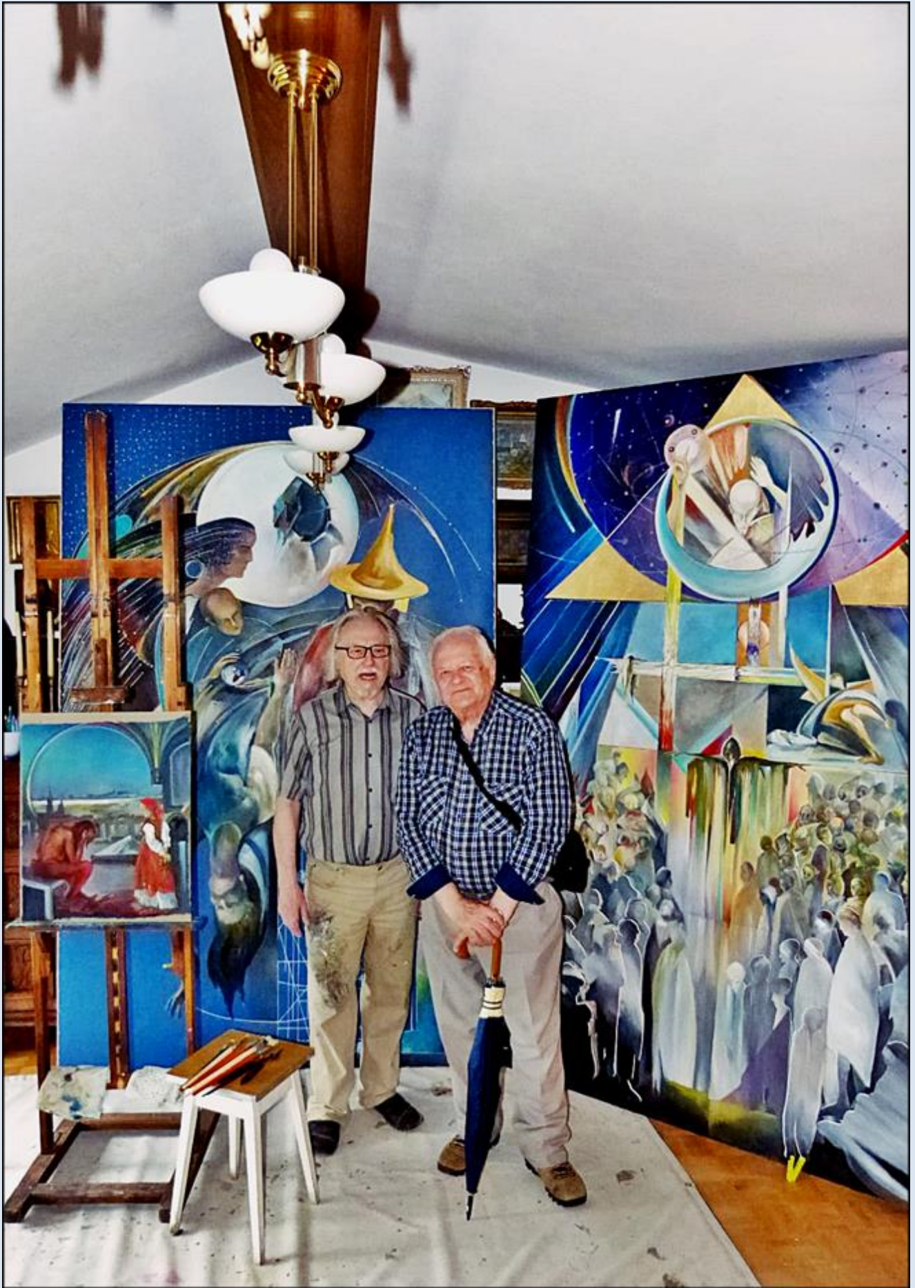
wspólne zdjęcie z Profesorem