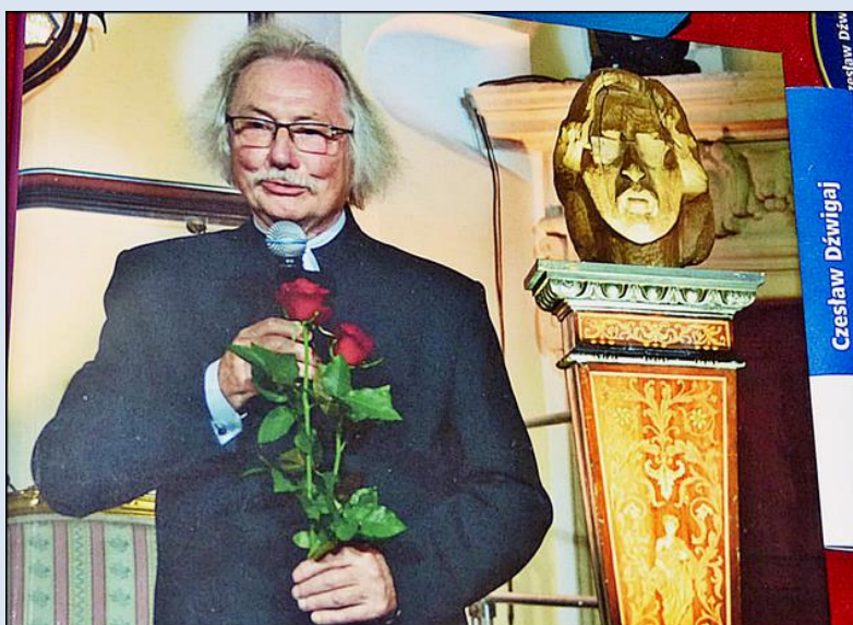
zdjęcia i opis: Jan Nitecki