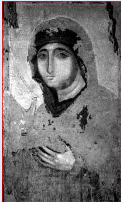
Santa Maria in Tempulo ikona przeniesiona później do Kościoła S. Maria del Rosario w Monte Mario

Obecnie w zdekonskrowanej świątyni odbywają się świeckie śluby.