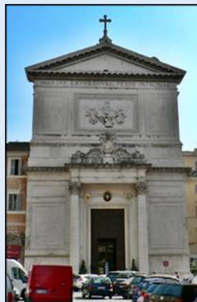
San Salvatore in Lauro (Piazza di San Salvatore in Lauro)