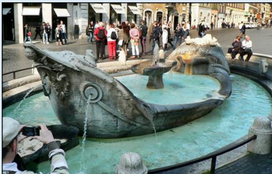
Fontanna przed Schodami Hiszpańskimi