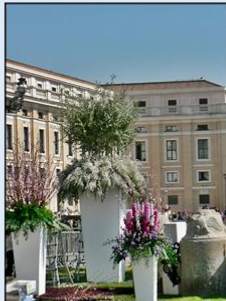
Wypoczynek na Awentynie pod drzewem pomarańczy – i ozdobne kwiaty na Placu św. Piotra