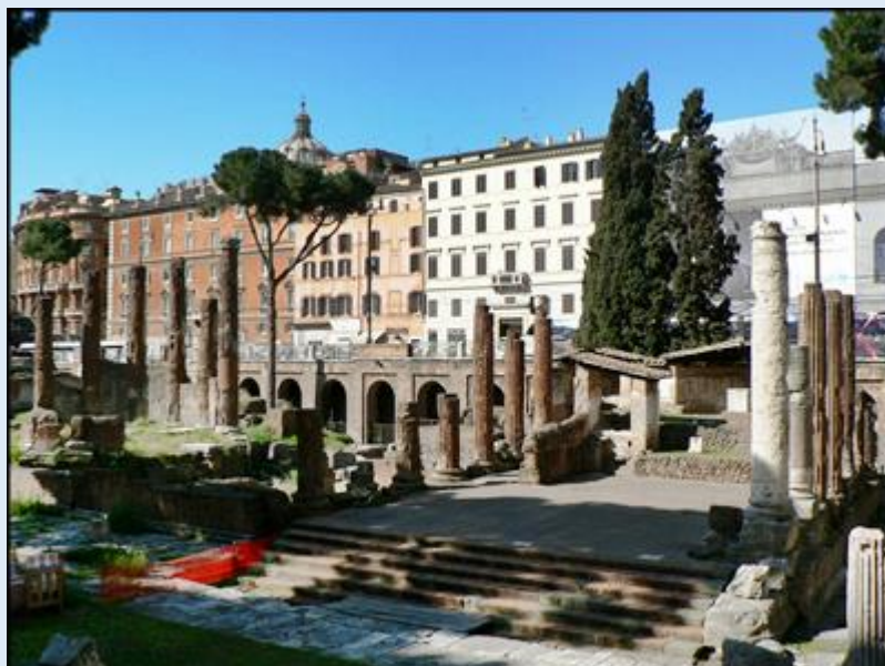
Ozdobne ogrodzenie przy Pałacu Barberinich – Ruiny najstarszych świątyń rzymskich