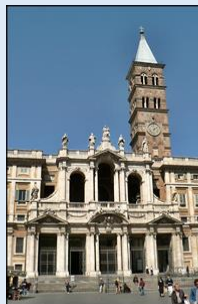
Bazylika św. Jana na Lateranie – Bazylika MB Większej