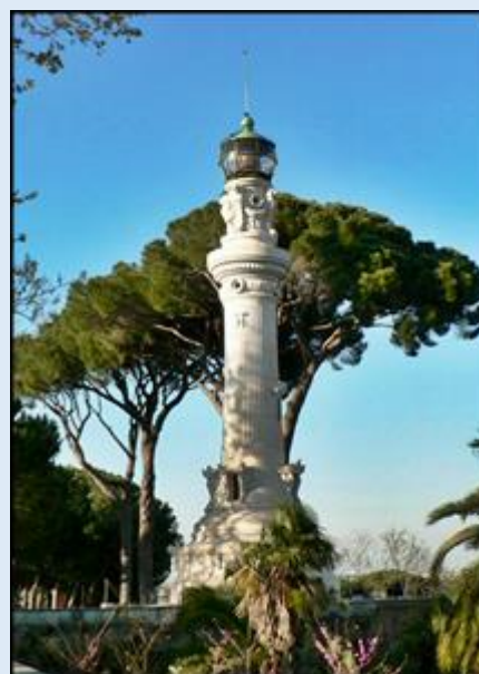
Jeden z obelisków rzymskich – Pomnik-latarnia morska na Wzgórzu Gianicolo