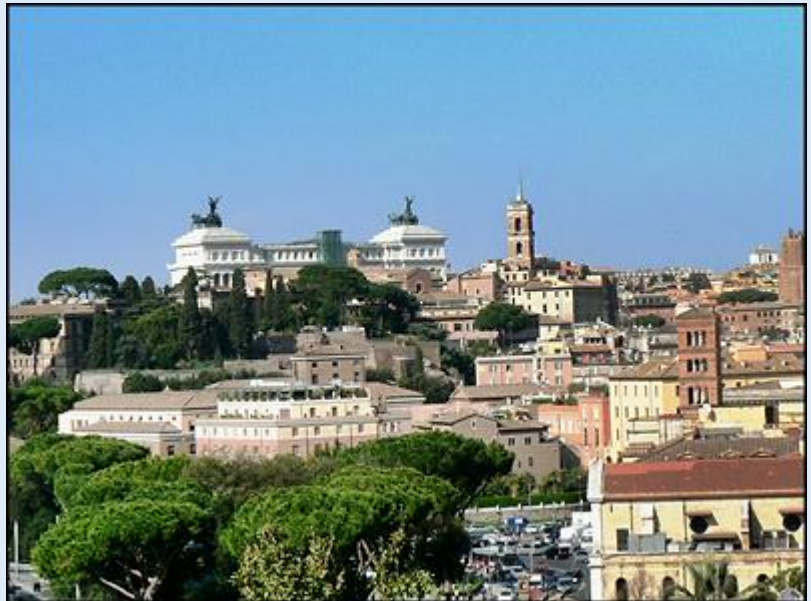
I jeszcze jedna fontanna – widok na Rzym ze wzgórza Gianicolo