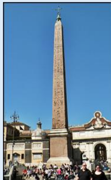
Zespół figur na Piazza del Popolo – i kolejny obelisk na tym placu