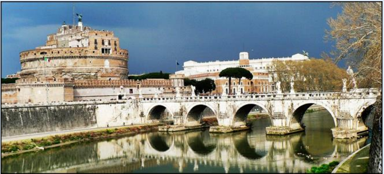
Most Anioła prowadzący do Zamku Anioła