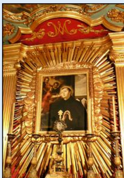
Ko. Madonna dei Monti –