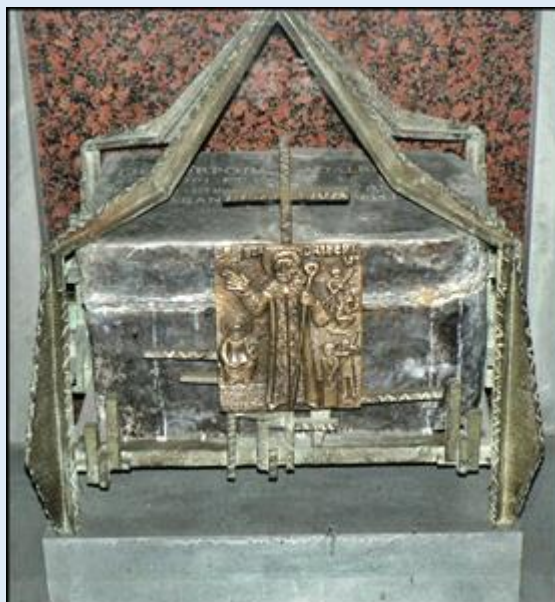
Obraz św. Wojciecha – relikwiarz św. Wojciecha