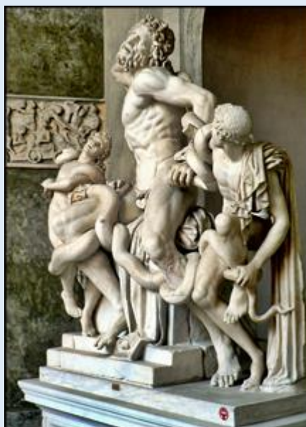
Grupa Laokoona w Muzeum Watykańskim