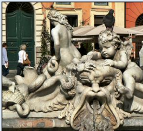
Fontanna di Trevi bliżej – i jeszcze bliżej