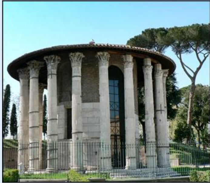
Fontanna Trytona na Placu Barberinich – świątynia Herkulesa na starym placu Forum Boarium