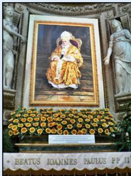
Kościół s. Carlo al Catinari – ko s. Marcello – ko. S. Spirito