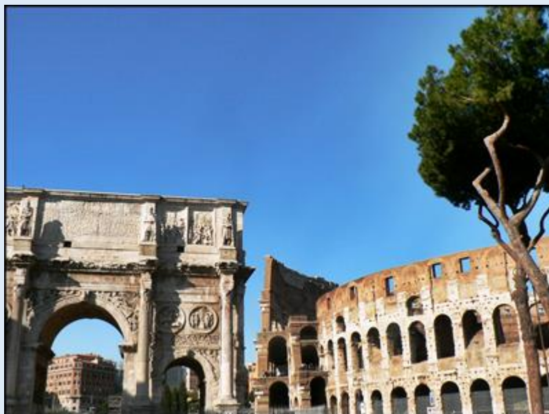
Łuk Konstantyna obok Koloseum