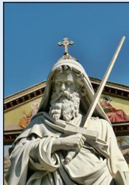
Bazylika św. Pawła za Murami – i jego figura przed Bazyliką