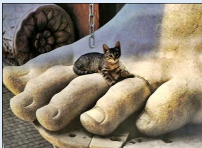
Rzym żegna z kotkiem na antycznej stopie. Jeśli chcesz zobaczyć więcej, przyciśnij link poniżej.

Topograficzny Słownik Starożytnego Rzymu POWRÓT DO STRONY GŁÓWNEJ IKONOGRAFII