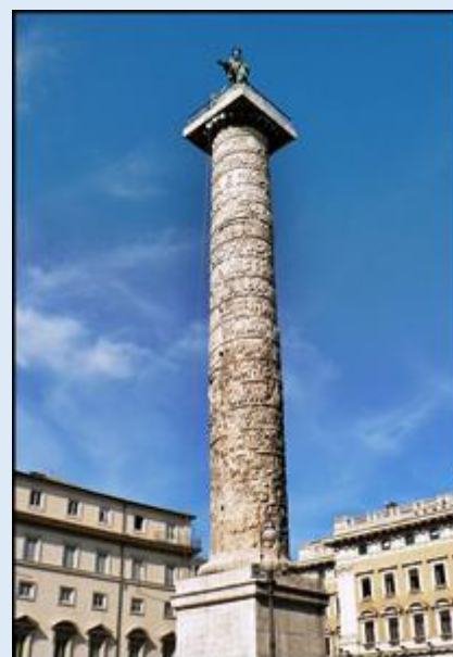
Schody Hiszpańskie – Kolumna Marka Aureliusza (obecnie z figurą św. Piotra)