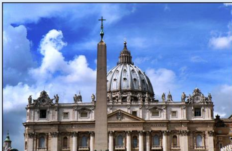
I jeszcze jeden egipski obelisk przed Bazyliką św. Piotra w Watykanie