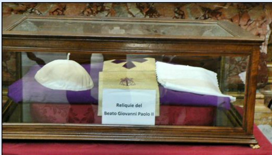
Ko. S. Salvatore in Lauro