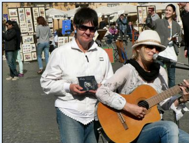
Autor opisu i zdjęć na Piazza Navona - i jego Małżonka na tymże placu