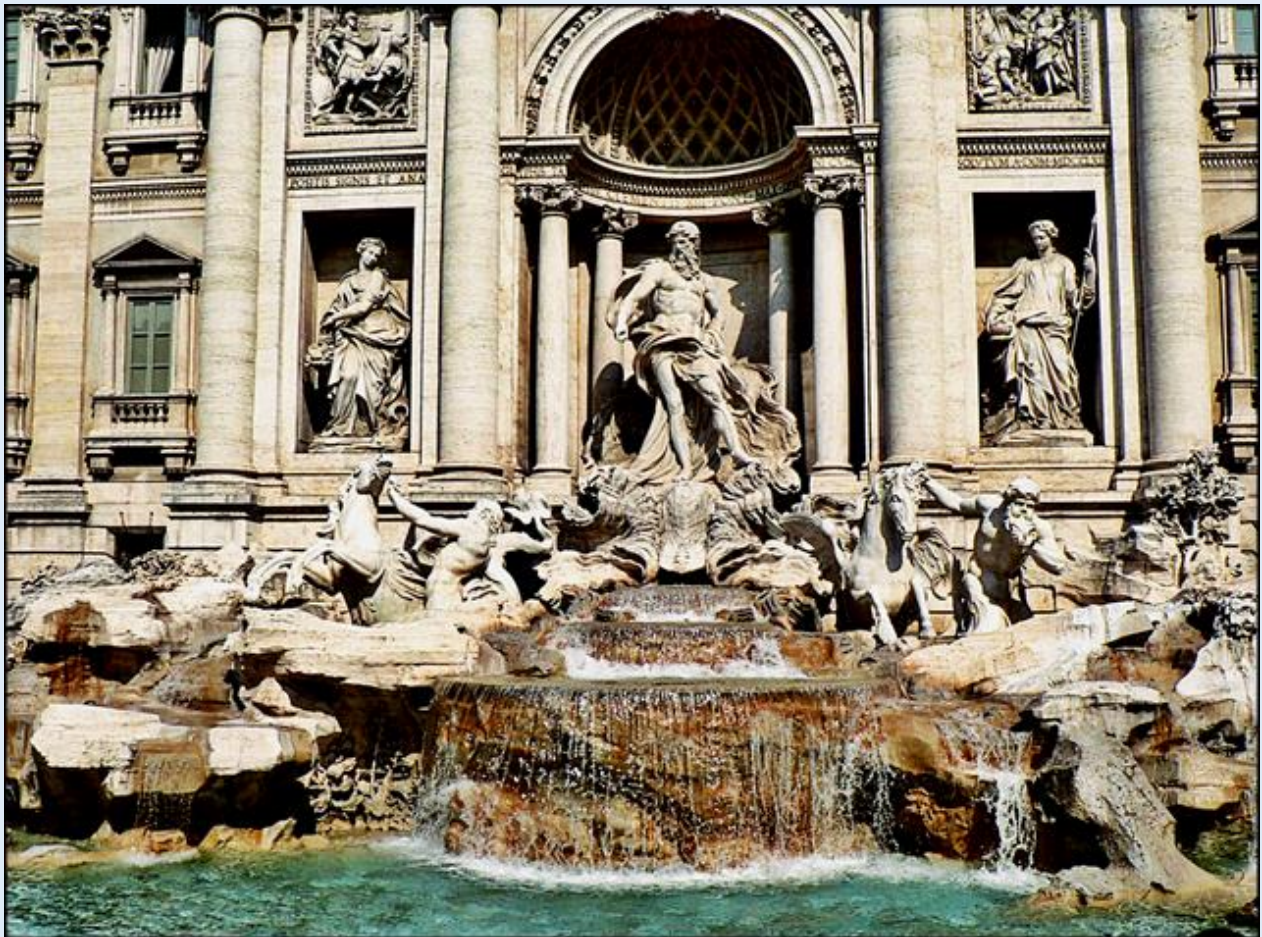
W dzień... i w nocy...