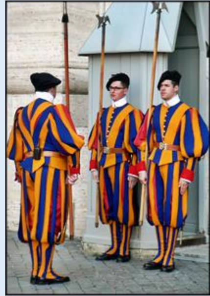
Fontanna na Placu św. Piotra – Gwardia Szwajcarska