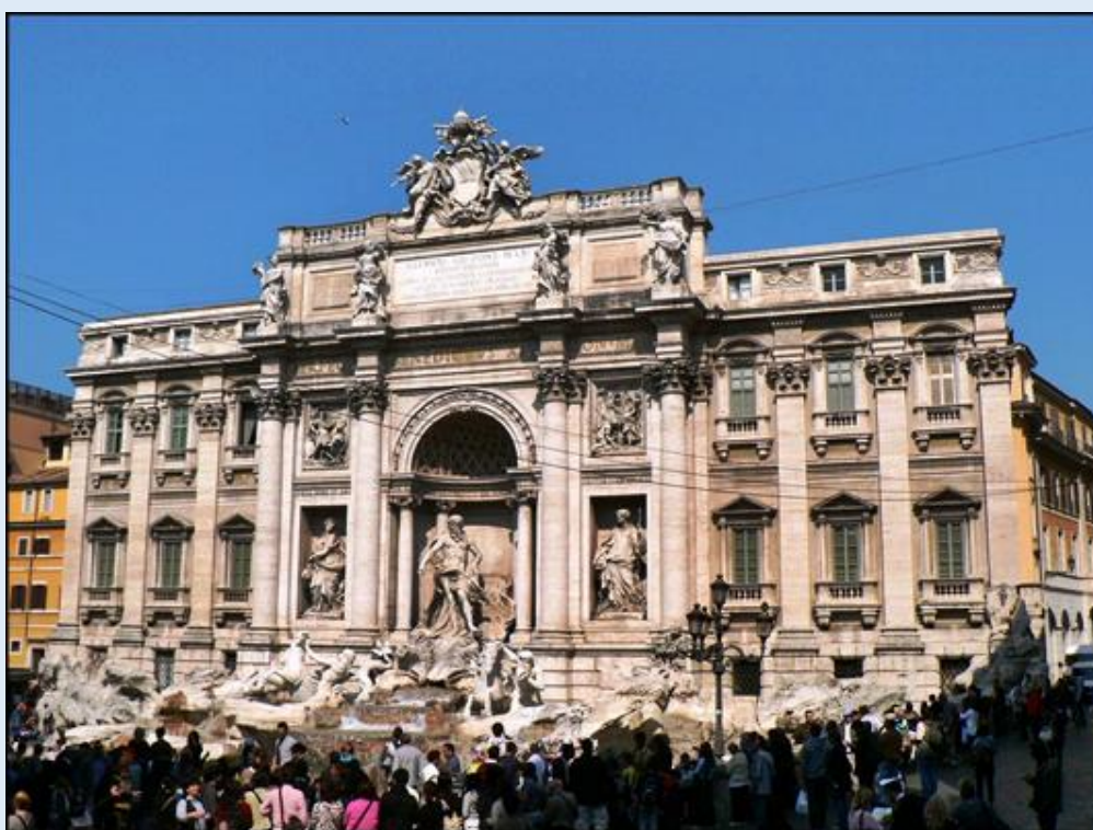
Fontanna di Trevi