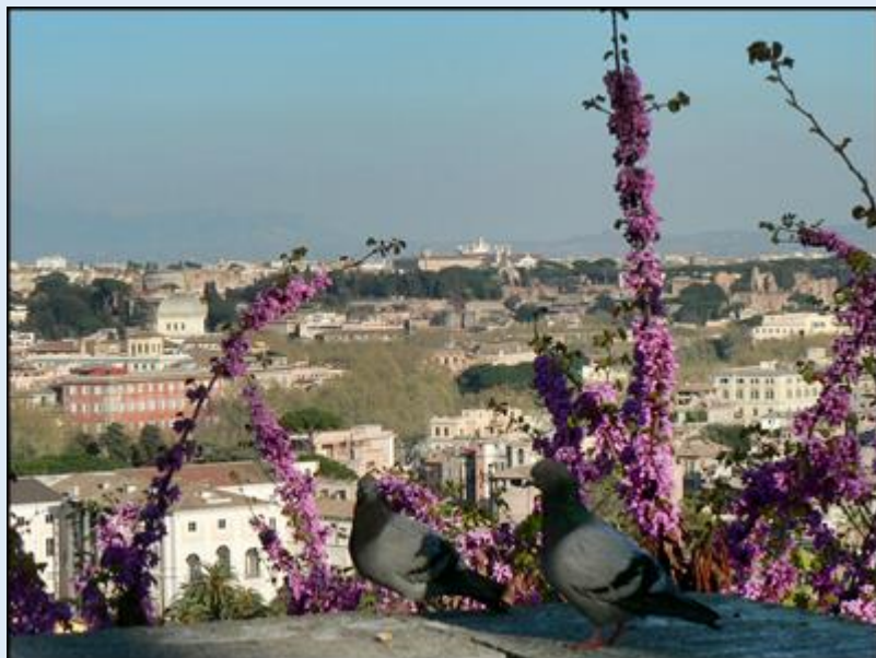
I ta kolumna w zbliżeniu – i jeszcze jeden widok z Monte Gianicolo