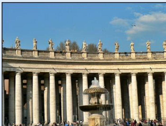
Kościół św. Stanisława – Kolumnada Berniniego na Placu św. Piotra