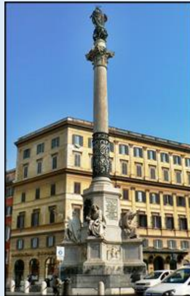
Pomnik na sąsiednim moście Viktora Emmanuela II – pomnik MB na Placu przed Bazyliką MB Maggiore