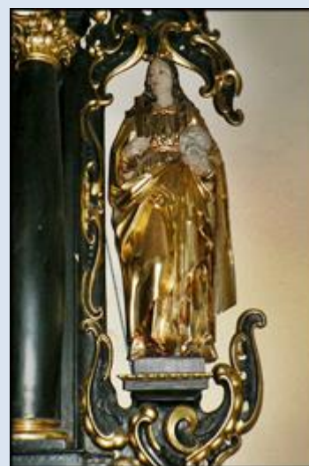
14. Radziechowice, ŁDZ, ob. w kd przyd. w lesie od wschodu wsi; 15. Toki, PDK, fg w kd przyd.; 16. Wieruszów, fg w Sankt. Pana Jezusa Pięciorannego