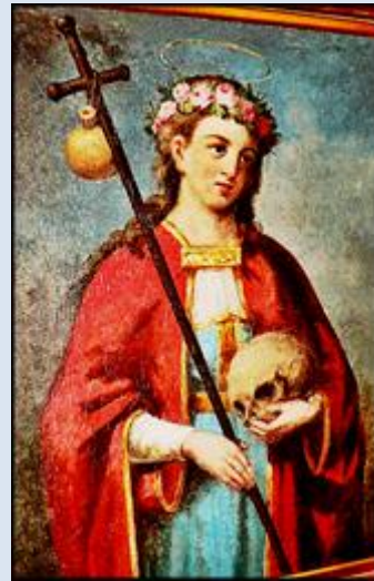
R4,17- Zajączki, ŚLS, fg w ko św. Franciszka; R4,18- Pacanów, ŚWK, ob. w baz. – Sankt. Chrystusa Ukrzyżowanego; R4,19- Włocławek, KPM, ob. w Muzeum Diecezjal.