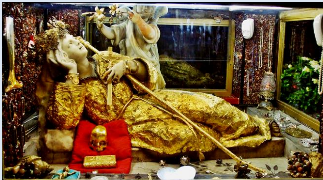
Sycylia, Palermo (Patronka tego miasta), Santuario de Santa Rosalia