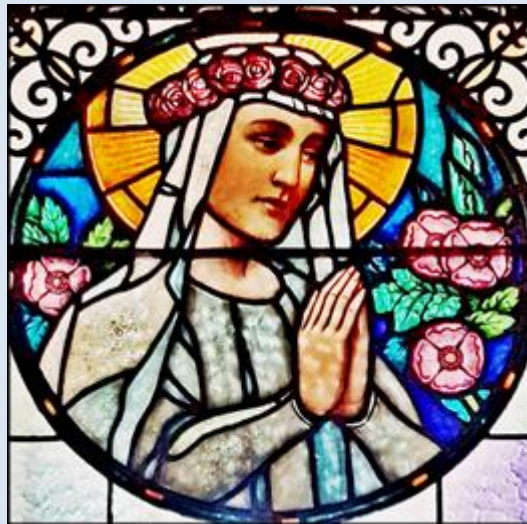
Siemianowice Śląskie, ko. św. Antoniego (zdz. pw)

Jeżeli nie zaznaczono inaczej, to zdjęcia: Jan Nitecki