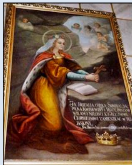
10. Radomsko, ob. na plebanii ko św. Lamberta; 12. Radomsko, ob. w ko św. Rocha; 13. Radziechowice, ŁDZ, ob. 2 w ko św. Rozalii;