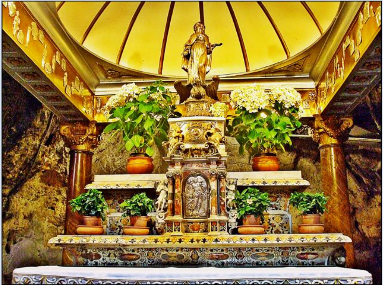
Sycylia, Palermo (Patronka tego miasta), Santuario de Santa Rosalia