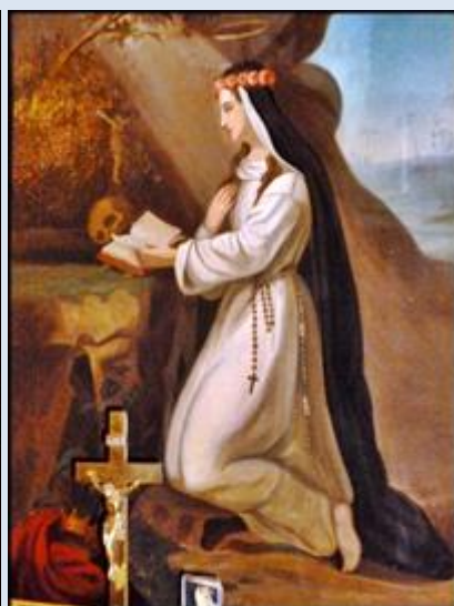
11. Radomsko, ob. w kp św. Rozalii;