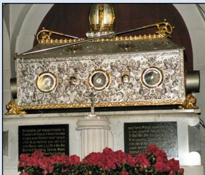
3. Katowice, rel. w baz. WNMP i św. Ludwika; R16,4- Katowice, rel. w baz. WNMP i św. Ludwika;