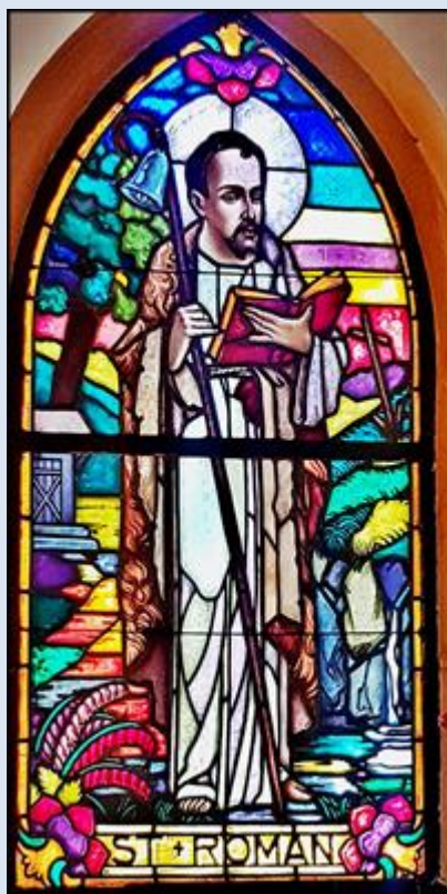
Piekary-Dąbrówka Wielka, Kaplica św. Antoniego (zdj. pw)

Jeżeli nie zaznaczono inaczej, to zdjęcia: Jan Nitecki