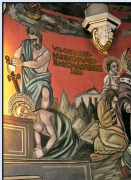
1. Katowice, fk w baz. WNMP i św. Ludwika; 2. Katowice, fk 2 w baz. WNMP i św. Ludwika;