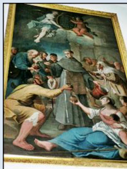
3. Łódź – Łagiewniki, rel. tr. w ko św. Antoniego; 4. Łódź – Łagiewniki, ob. 2 w ko św. Antoniego;