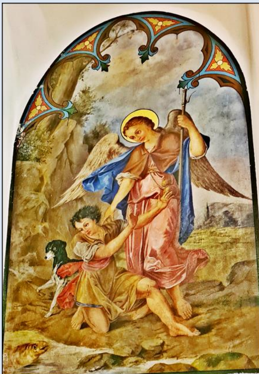
Oświęcim, Sankt. MB Wspomożenia Wiernych