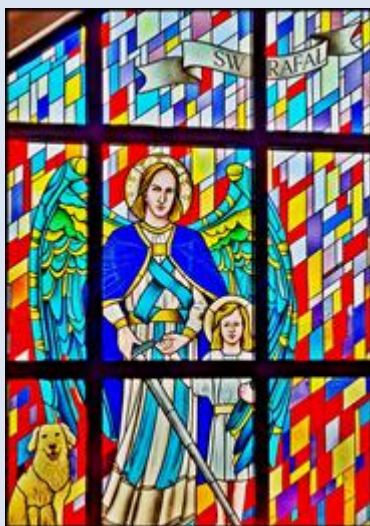
Zabrze, Ko. św. Wojciecha