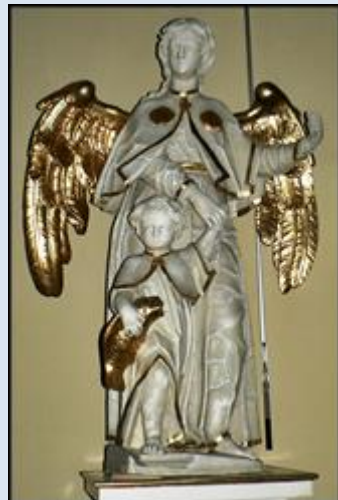
1. Szczurowa, MAŁ, fg z 1911 r. k. ko paraf.;