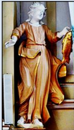
7. Kraków, fg w baz. Bożego Ciała;