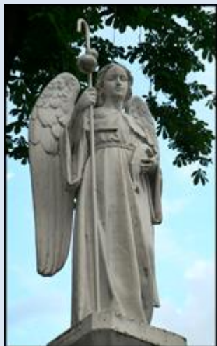
3. Kępno, fg w ko św. Marcina;