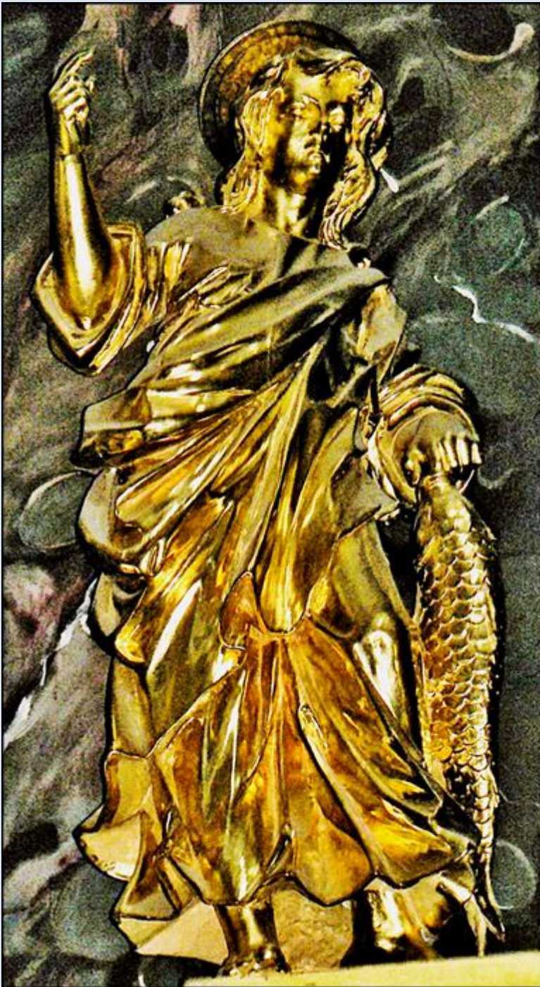
Kraków, figura w Kościele pw. św. Apostołów Piotra i Pawła