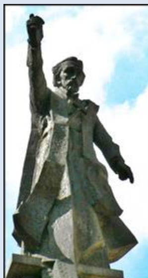
P40,4- Warszawa, fg – pk przy ko św. Stanisława BM; [p. str. 1] P40,5- Częstochowa, wt w baz. Św. Rodziny; P40,6- Kraków, pk k. ko św. Ap. Piotra i Pawła

Jeżeli nie zaznaczono inaczej, to zdjęcia: Jan Nitecki