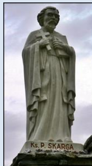
1. Kraków, fg w ko śś. Ap. Piotra i Pawła; P40,2- Tylicz, MAŁ, pł. w ko Imienia Maryi; P40,3- Tylicz, MAŁ, fg na Kalwarii;