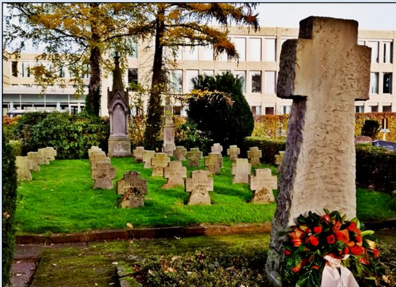
Cmentarz z grobami z czasów II Wojny Światowej oraz pomnikiem z Wojny Francusko-Pruskiej (1870-71)