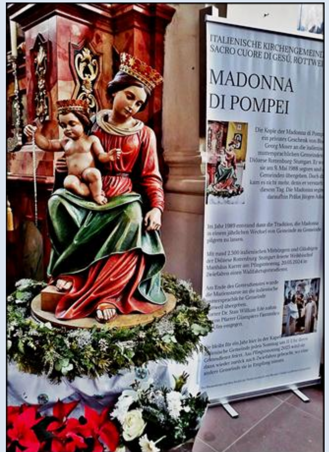
Pompeje - Bazylika pw. MB Różańcowej (Santuario della Beata Vergine del Rosario)