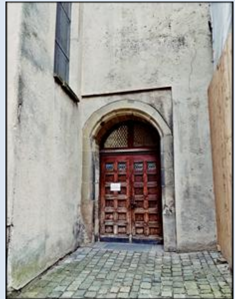
zdjęcia i opis: L.P.