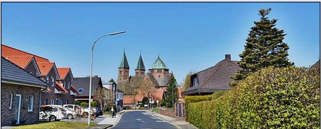
zdjęcia i opis: L.P.