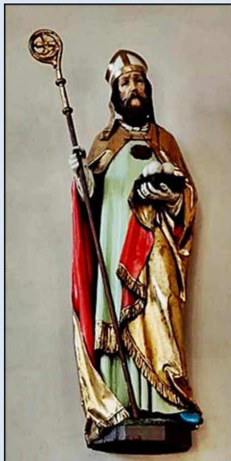
Patron, św. Mikołaj, na zewnątrz i wewnątrz kościoła