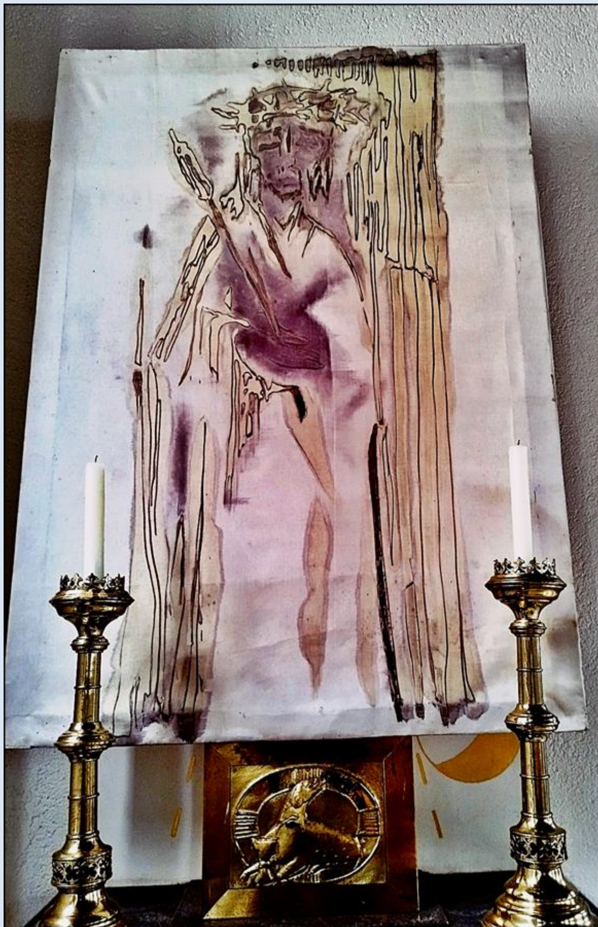
(Wielki Piątek 2025)