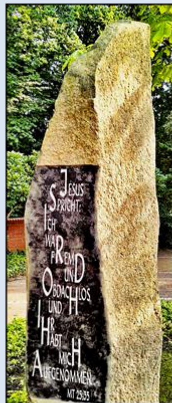
Zdjęcia i opis: L.P.