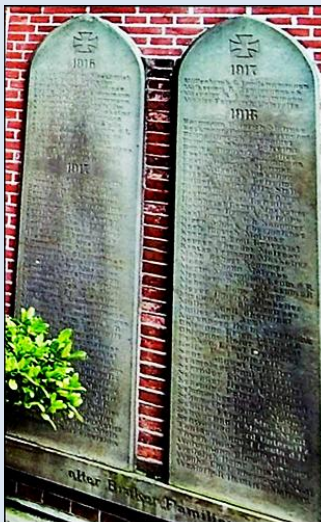
zdjęcia i opis: L.P.