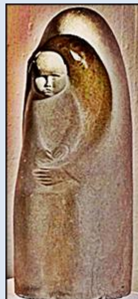
zdjęcia i opis: L.P.