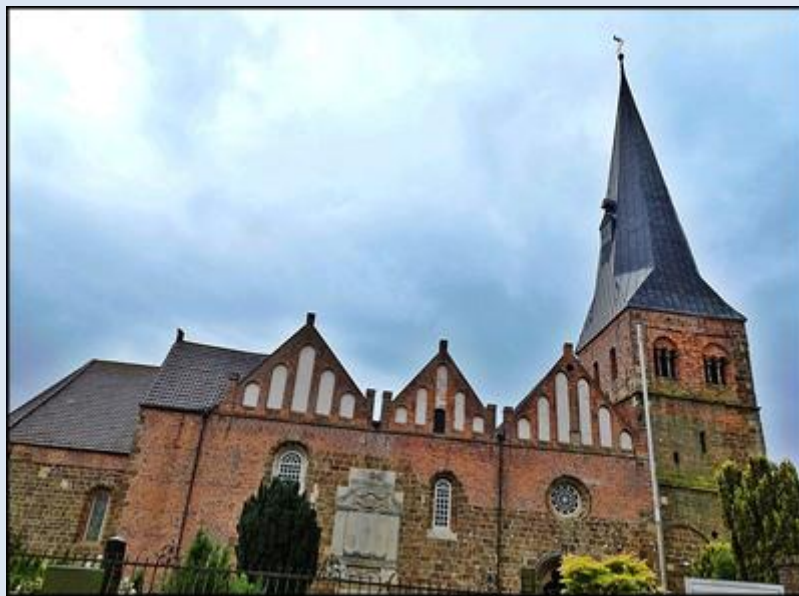
zdjęcia i opis: L.P.