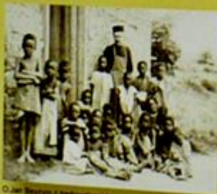
O. Jan Beyzym z trędowatymi dzieci

"Ja odchodzę, ale moje serce zostaje z wami". W dniu 18 sierpnia 2002 roku podczas Mszy świętej na krakowskich Błoniach Ojciec Święty Jan Paweł II dokonał beatyfikacji czterech Sług Bożych. Wśród błogosławionych był także Posługacz Trędowatych. Ojciec Jan Beyzym dołączył do grona polskich jezuitów wyniesionych na ołtarze. Prośmy Boga o łaski za przyczyną "Posługacza trędowatych" oraz o rychłą jego kanonizację.