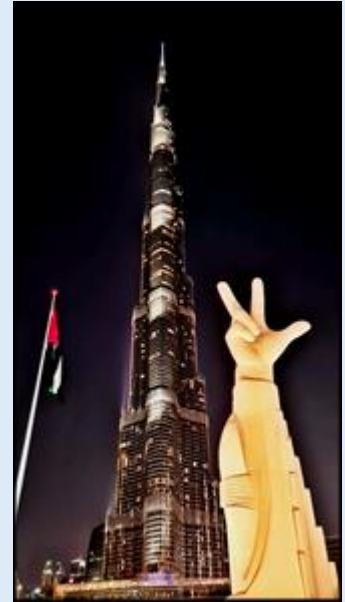
Burdż al-Arab - Burdż Chalifa