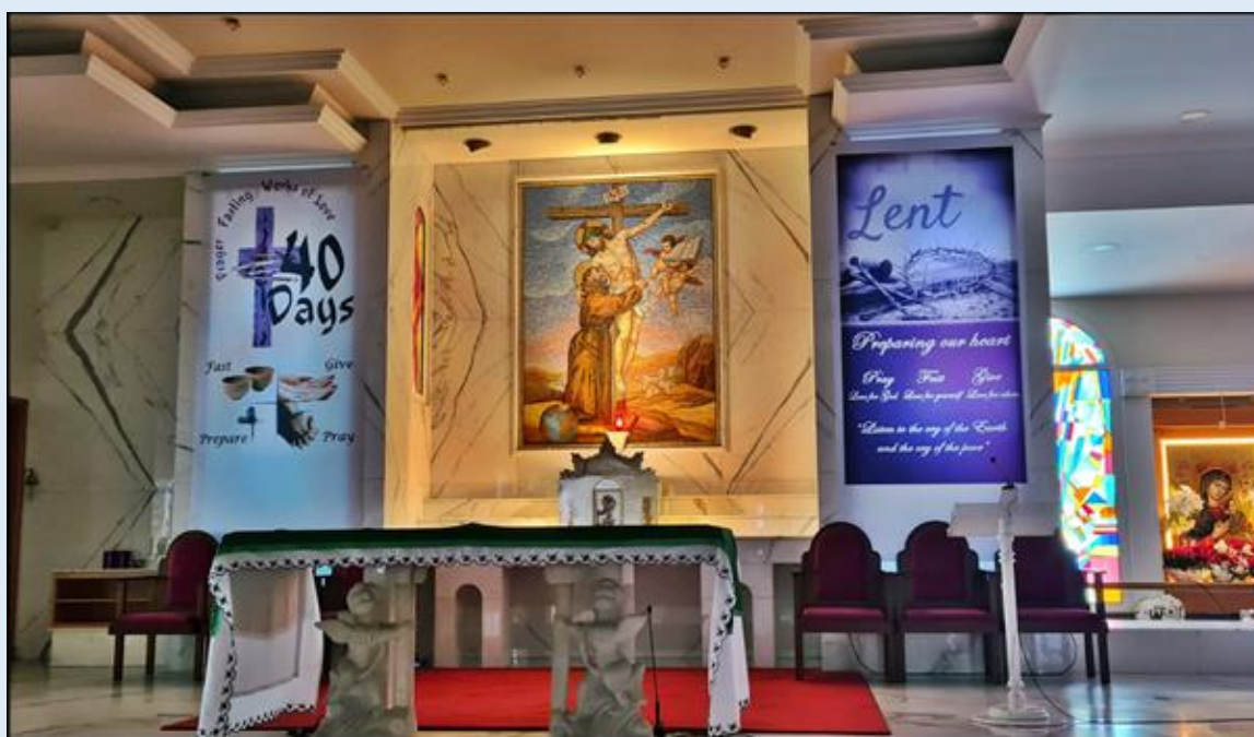
Kościół pw. św. Franciszka