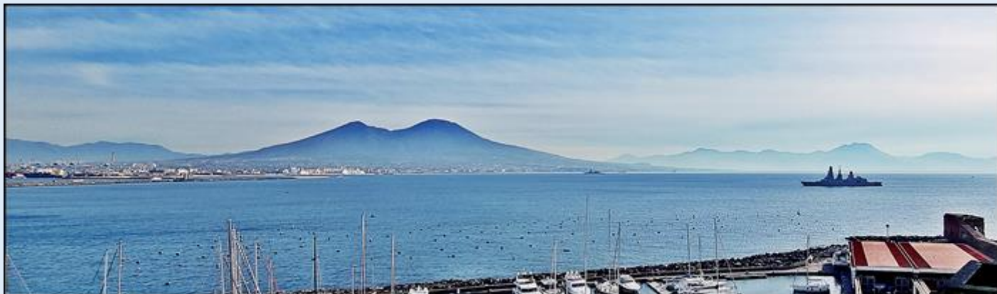
widok na port i Wezuwiusz z Castel dell' Ovo