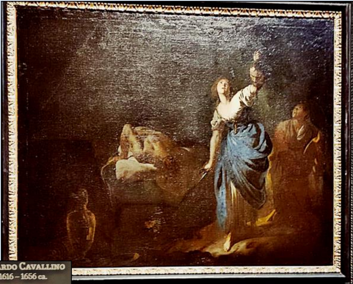
BERNARDO CAVALLINO Napoli, 1616 – 1656 ca.