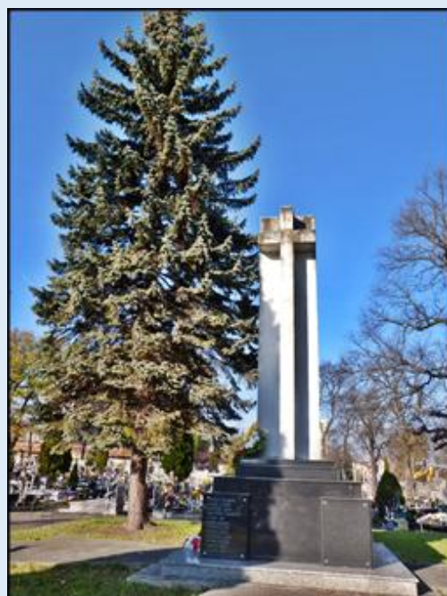
Pomnik Ofiar Katastrofy Smoleńskiej