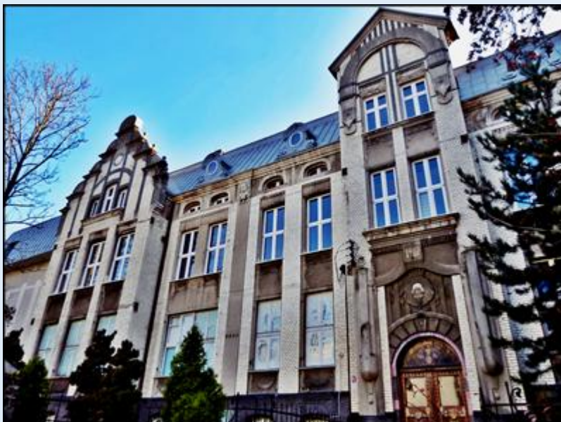
Zabytkowy szpital im. św. Karola Boromeusza