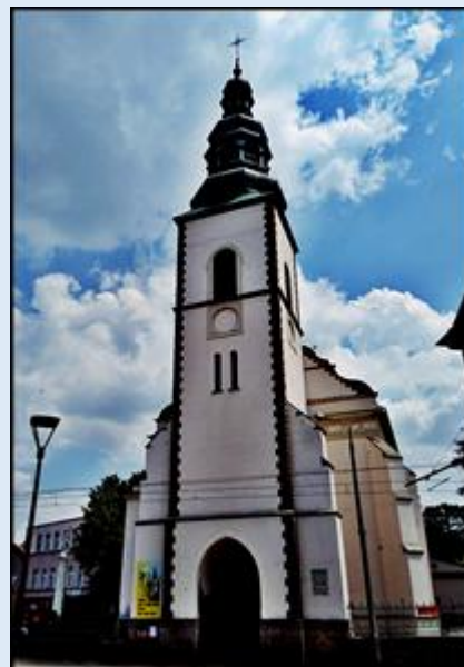
Zob. Kościoły Mysłowic