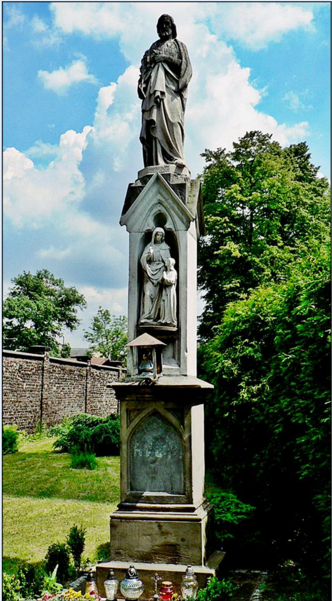
Pomnik św. Józefa z XIX w. k. Ko. NSPJ