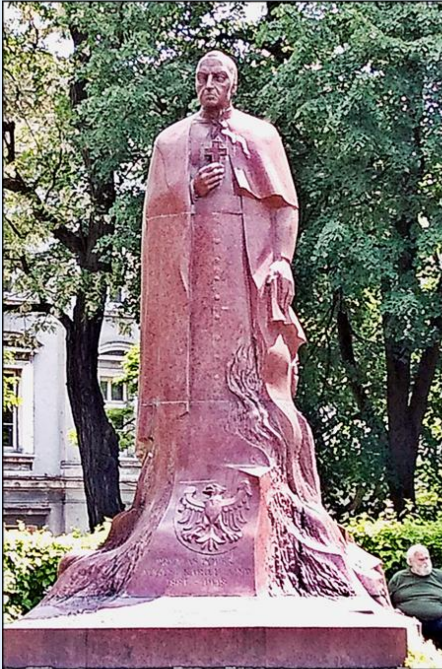
Pomnik śl. B. kard. Augusta Hlonda