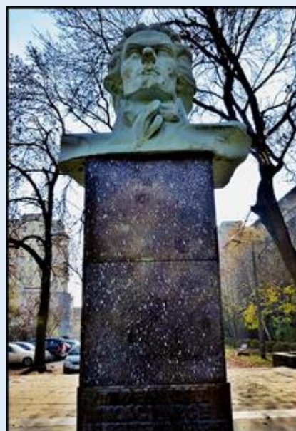
Budynek I LO im. Tadeusza Kościuszki - Pomnik Tadeusza Kościuszki