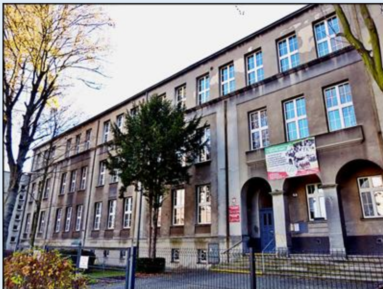
Budynek II LO im. Powstańców Śląskich