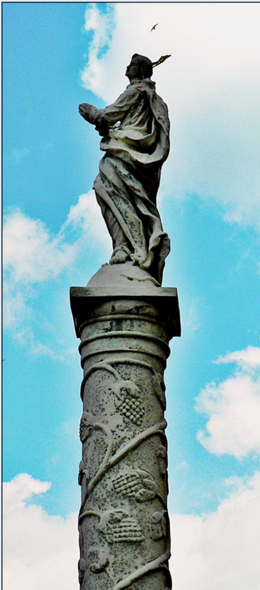
Kolumna MB z 1727 r. k. Ko. NSPI