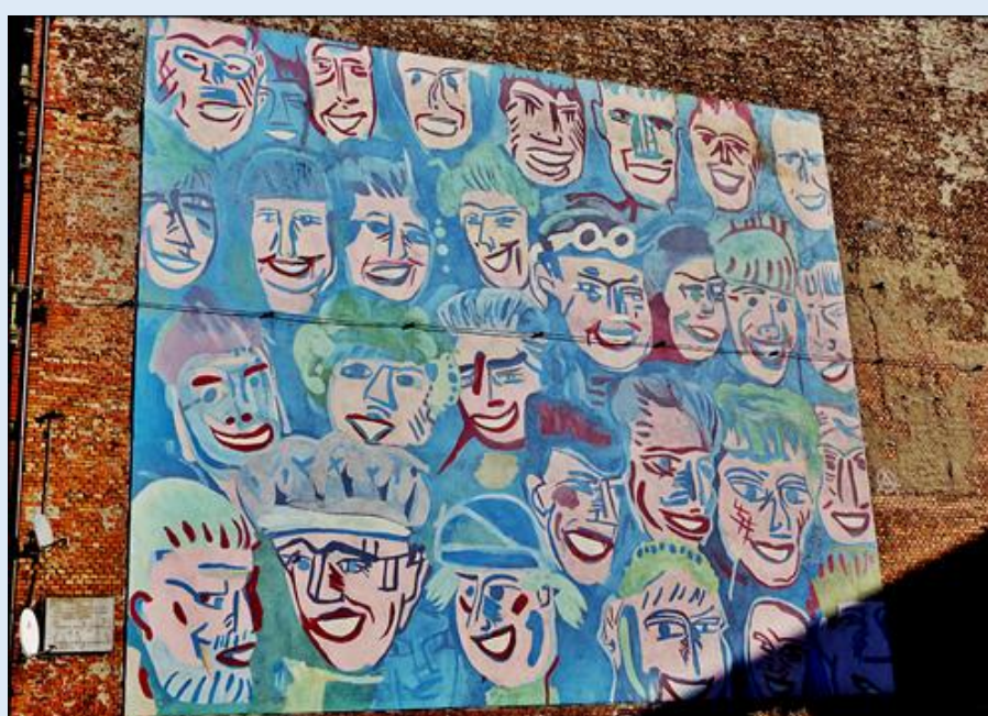
Mural Edwarda Dwurnika na ścianie więzienia