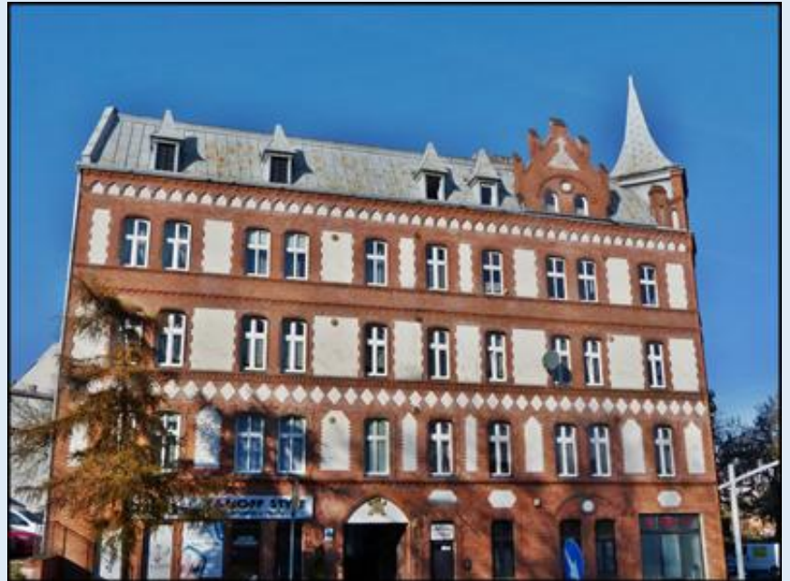
Zabytkowa kamienica - ul. Oświęcimska / Mikołowska