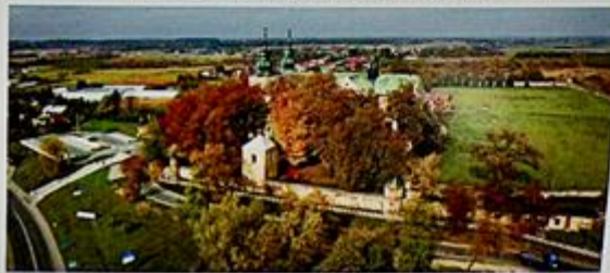
Klasztor Kanoników Regularnych Laterańskich w Wąnczerzowie

W Mokrzyszu przy ul. Kościelnej zachowane stare domy o historycznym usytuowaniu szczytem do ulicy. Gmina Mstów (do 1952 r. gmina Wąnczerzów) graniczy z miastem Częstochowa, powierzchnia wynosi 119,84 km 2 , a ludność liczy 10 760 mieszkańców, którzy zamieszkują 22 miejscowości. Ponad 60% obszaru gminy leży w granicach i otulinie parku krajobrazowego Orlich Gniazd. Użytki rolne zajmują 79%, a lasy 14,7% powierzchni gminy. Ich drzewostan tworzą bory sosnowe oraz mniejsze zespoły lasów liściastych z lipą, grabem, klonem i dębem. Nazwa Mstowa, pochodzi prawdopodobnie od imienia Msta, być może przelozonego lub dowódcy słowiańskiego plemienia, zamieszkującego okoliczne tereny przed powstaniem państwa polskiego.