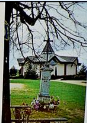
Sanktuarium św. Ojca Pio

zaboru i powstałej granicy między zaborcami na rzece Warcie klasztor mstowski przyporządkowano do pobliskiej wsi Wąnczerzów, do której nadal przynależą administracyjnie. Wąnczerzów jest jedną z największych miejscowości w gminie, graniczy bezpośrednio z siedzibą gminy. Powstał w XIV w. za prepozyta klasztoru ks. Marcina de Vyncz (z Walcza). W wyniku zaborów do niego obecnie administracyjnie przynależy zespół kościelno-klasztorny kanoników regularnych laterańskich zwany klasztorem mstowskim. W zachodniej części gminy leży jedna z najdłuższych miejscowości, Jaskrów pochodząca z pierwszej połowy XIII w. Najstarszą jej częścią to ulica Starowiejska. Dwie duże miejscowości Mokrzysz i Zawada położone są we wschodniej części gminy.