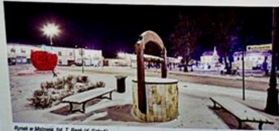
Rynek w Mstowie