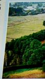
Warta w Gminie Mstów, fot. M. Szewc

Warta jest najkrowsko-Wieluński ścią rzeką w Polsce. źródło wypływa w wie. Rzeką przepływa zmienia kierunek na przez Mirowski Przełku rzeka zaczyna i północ przepływają Kłobukowice.