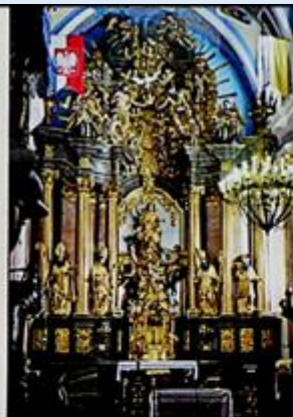
Altarz w kościele w Wąnczerzowie

zaboru i powstałej granicy między zaborcami na rzece Warcie klasztor mstowski przyporządkowano do pobliskiej wsi Wąnczerzów, do której nadal przynależą administracyjnie. Wąnczerzów jest jedną z największych miejscowości w gminie, graniczy bezpośrednio z siedzibą gminy. Powstał w XIV w. za prepozyta klasztoru ks. Marcina de Vyncz (z Walcza). W wyniku zaborów do niego obecnie administracyjnie przynależy zespół kościelno-klasztorny kanoników regularnych laterańskich zwany klasztorem mstowskim. W zachodniej części gminy leży jedna z najdłuższych miejscowości, Jaskrów pochodząca z pierwszej połowy XIII w. Najstarszą jej częścią to ulica Starowiejska. Dwie duże miejscowości Mokrzysz i Zawada położone są we wschodniej części gminy.