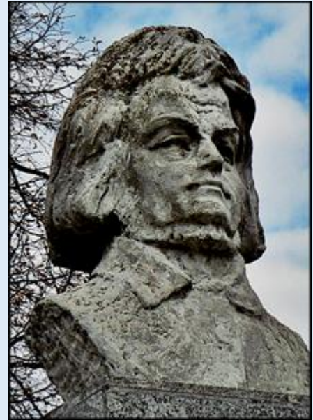
Pomnik Adama Mickiewicza