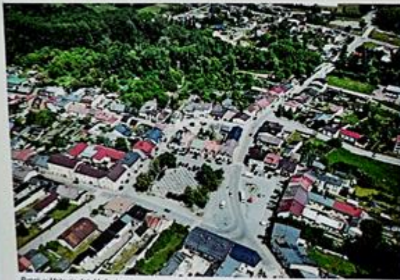
Rynek w Mstowie

już w drugiej połowie XII wieku wybudowali tu swój klasztor będąc do końca XVIII wieku właścicielami Mstowa i okolicznych miejscowości. W 1279 roku Mstów otrzymał prawa miejskie stając się najstarszym i najznaczniejszym ośrodkiem miejskim w regionie. Do XVI wieku przewyższał gospodarczo pobliską Częstochowę. Z dawnej świetności zachował się zabytkowy średniowieczny układ urbanistyczny oraz obronny zespół klasztorny kanoników regularnych laterańskich stanowiący najważniejszy sakralny zabytek nie tylko Mstowa i gminy, lecz również powiatu częstochowskiego ziemskiego. W wyniku drugiego