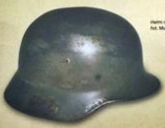
Hełm niemiecki wz. 40, fot. Muzeum AK