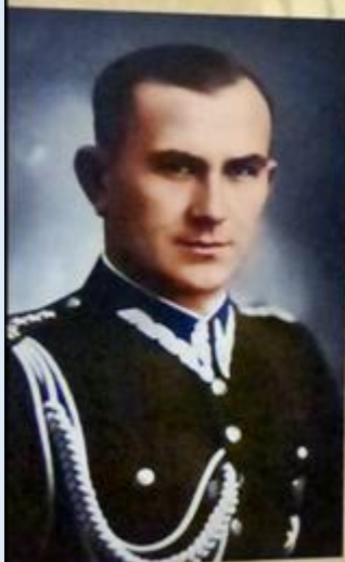
Płk Władysław Liniarski „Mściwój” - komendant Okręgu Białostok AK