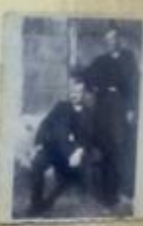
Wojownicy „Szarych” w akcji „Burza”