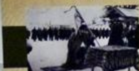
Uroczyste przekazanie sztandaru polowemu batalionowi 27 WDP AK, lipiec 1944 r.