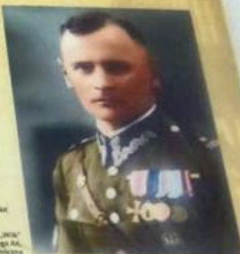
Por Aleksander Krzyżanowski „Milk” - komendant Okręgu Wileńskiego AK, fot. domowa publiczna

Operacja „Ostra Brama” była kluczowa akcja Armii Krajowej mająca na celu wyzwolenie Wilna przed wkroczeniem Armii Czerwonej. Dowództwo operacji powierzono komendantowi Okręgu Wileńskiego Aleksandrowi Krzyżanowskiemu „Milkowi”, a w skład sił operacyjnych weszły połączone oddziały przedwojenne oddziały Wojska Polskiego z okręgów Wilno i Nowogródek liczące ponad 12 tysięcy żołnierzy.