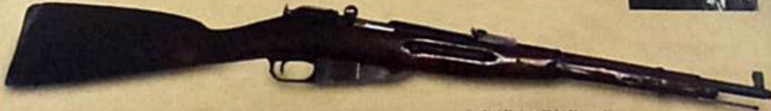
Karabin Maszynowy wz. 38