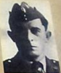
Mjr Henryk Krzyżanowski „Orzeł” - komendant Okręgu Polesie oraz 30 DP AK, fot. AAB