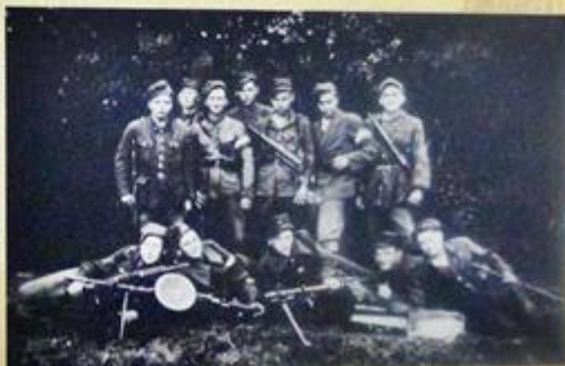
Zdjęcie i batalion 43 Pułku Piechoty AK, lipiec 1944 r.

Niemcy, świadomi obecności 27 WDP AK oraz sowieckich oddziałów partyzanckich w lasach szackich, postanowili przeprowadzić akcję likwidacyjną. I tak w maju ponowili atak na stacjonujących w lasach żołnierzy. 27 WDP AK przebiła się z okrażeń na północ z zamiarem przekroczenia Przypeci, ale otrzymane rozkazy dowództwa AK nakazywały przemaszerować na Bug. Wszyscy żołnierze udali się na wschód. Ci, którzy przekroczyli rzekę, zostali zabici przez Niemców lub straszotowani i rozbrojeni przez Sowieców. W czerwcu i lipcu 1944 r. 27 WDP AK kontynuowała walki w ramach „Burzy” na Lubelszczyźnie. 25 lipca 1944 r. na obszar operacyjny żołnierzy AK z Wołynia weszły jednostki Armii Czerwonej, które rozbroiły akowców. Dzień później dowództwo rozwiązało dywizję.