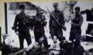
Zdjęcie i kompania 3 batalionu 43 Pułku Piechoty AK, lipiec 1944 r.