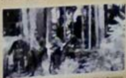
1944 żołnierze oddziału „Szarych” w akcji „Burza” w Obwodzie Suwalskim