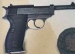
Pistolet Walther P-38

Ziemie województwa śląskiego, zachodnią część województwa krakowskiego, Zagłębie Dąbrowskiego oraz część powiatu olkuskiego w czasie II wojny światowej zostały wcielone bezpośrednio do III Rzeszy. Na tych obszarach po wale partyzanckich pozostał Okręg Śląsk EW-AM składający się z pięciu inspektoratów. Wiosną 1944 r. na podległym sobie terytorium. Liczebność konspiracyjnego szosowania była wówczas na 25-28 tys. Ponadto z przyjetymi planami okręg miał odwołać dwie dywizje partyzanckie: 21 i 23, prowadzić działalność militarną na tyłach wrogującego się Nacjonalistycznego Ruchu Wyzwolenia i grabieża oraz wywrócić KL Auschwitz-Birkenau. Zorganizowany charakter szosowania spowodował, że bojowa działalność oddziałów partyzanckich skupiała się na północno-wschodnich rubieżach okręgu oraz na podziemiu w Zagłębiu Śląskim i Żywieckim. W połowie sierpnia 1944 r. ppłk Janek zorganizował komendę oddziałów partyzanckich w związku z rozkazem popieszczenia na pomoc walczącym Narciarzom. Stan ubrojenia zmobilizowanych żołnierzy wykazywał jednak taki deficyt: