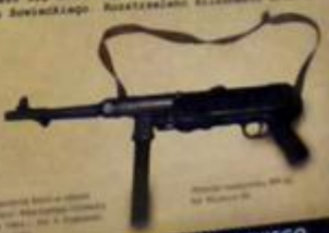
Broń maszynowa wz. 38