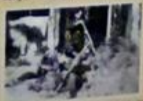
Wojownicy „Szarych” w akcji „Burza” w Obwodzie Suwalskim