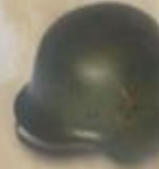
Hełm niemiecki M 35