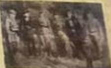
Żołnierze Armii Krajowej w Puszczy Białowieskiej