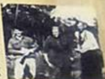
Wojownicy Armii Krajowej w Puszczy Białowieskiej