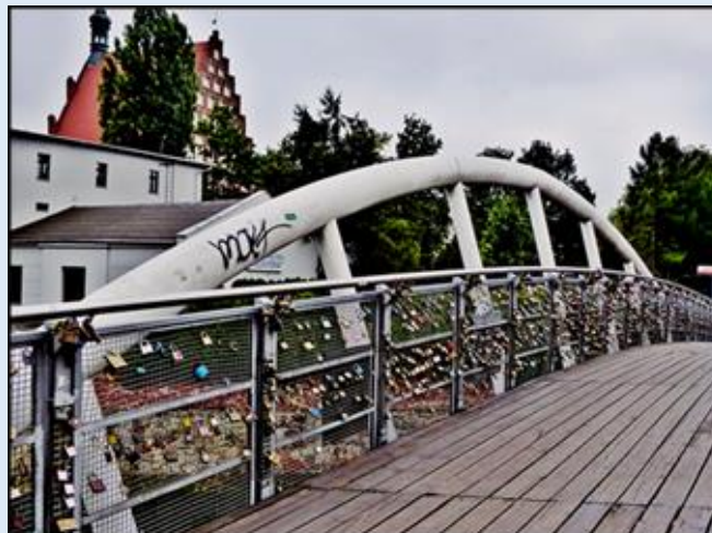
Wrocław i Bydgoszcz