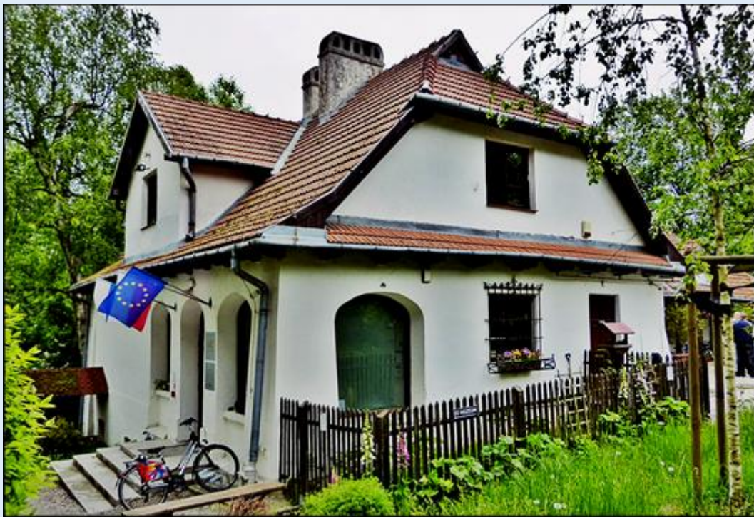
Kraków-Bronowice Małe - 'Rydłówka' - miejsce 'Wesela'