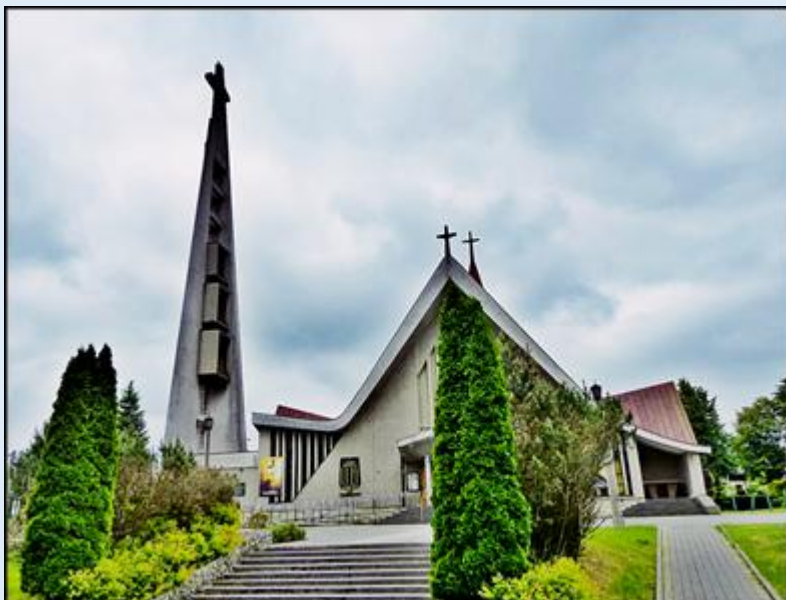
Kościół pw. św. Antoniego Padewskiego