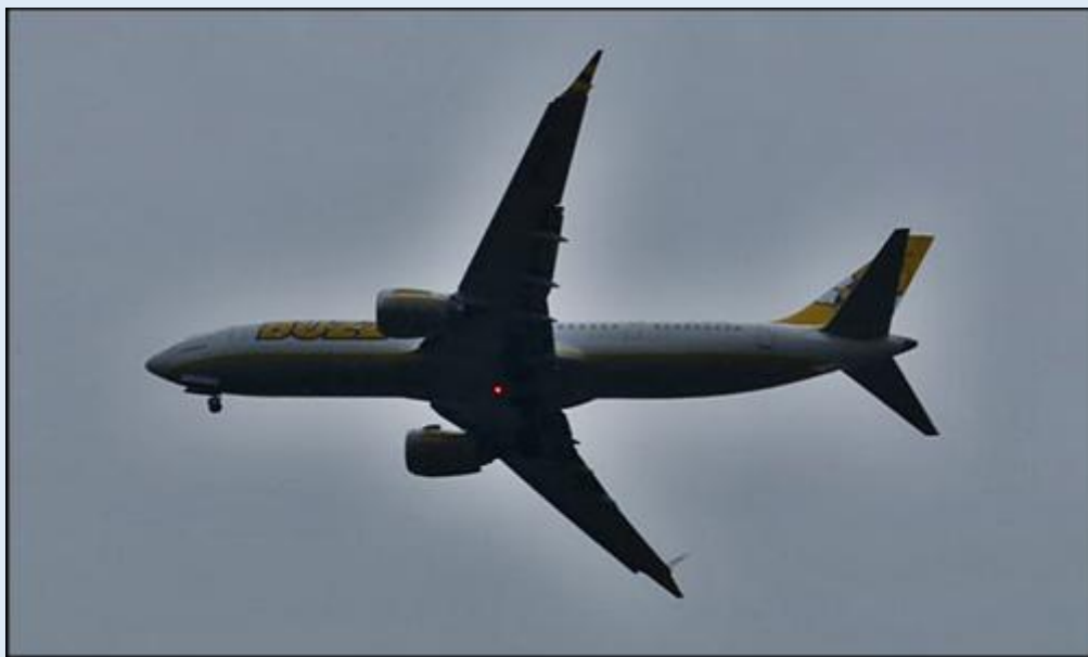
Pobliskie lotnisko w Balicach