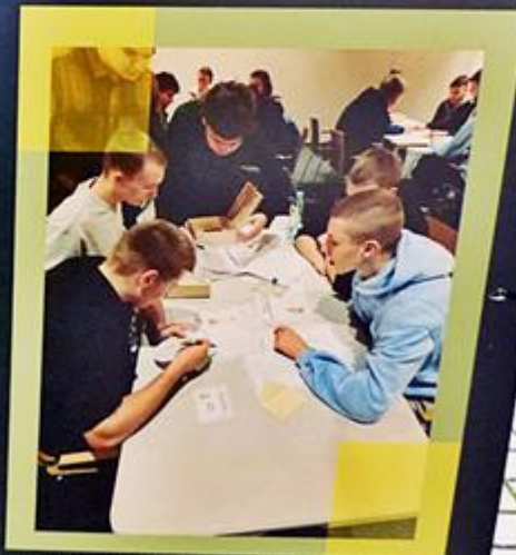
Gra detektywistyczna „Na tropie ludzi (nie)zwykłych”

Zapraszamy do zwiedzania Panteonu z przewodnikiem oraz do udziału w zajęciach przygotowanych z myślą o uczniach szkół podstawowych i ponadpodstawowych. Działalność edukacyjna instytucji obejmuje lekcje oraz warsztaty poświęcone postaciom upamiętnionym w Panteonie Górnośląskim oraz historii Polski i Górnego Śląska w XX i XXI wieku.