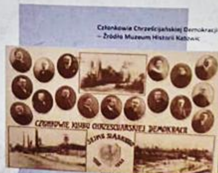
Członkowie Chrześcijańskiej Demokracji