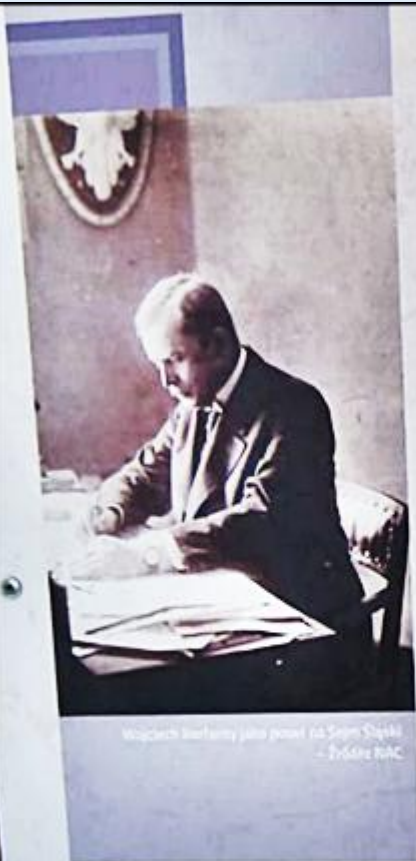
Współce kieramy jako premier na Sejm Śląski