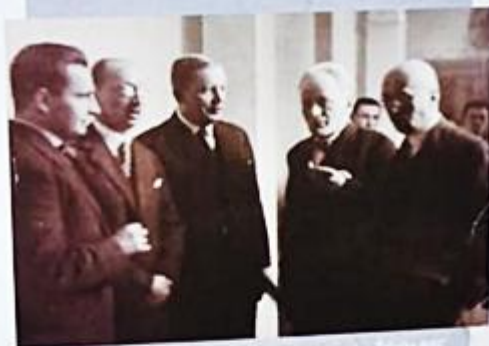
Władysław Korfanty podczas procesu brzeskiego - Żółty 1930