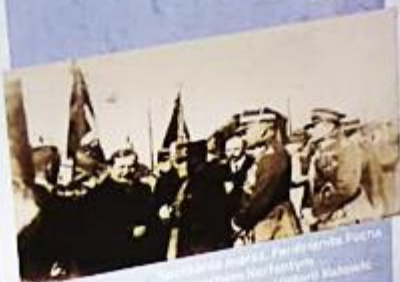
Wojciech Korfanty z innymi uczestnikami powstania śląskiego

Wojciech Korfanty wysunął propozycję podziału obszaru plebiscytowego, nazwanego później linią Korfantego. Po niekorzystnej dla Polaków interpretacji wyników plebiscytu, przeprowadzonego zresztą w atmosferze wzajemnego zastraszania, terroru i obustronnej manipulacji (np. strona niemiecka sprowadziła 180 000 wyborców z Górnym Śląskiem). Korfanty 2 maja 1921 roku złożył dymisję ze stanowiska komisarza plebiscytowego, a następnego dnia, gdy powstanie wybuchło, ogłosił się jego dyktatorem. Do 10 maja wojska powstańcze zajęły tereny wyznaczone linią Korfantego, a miasta objęto blokadą, czyli „cernowaniem”.