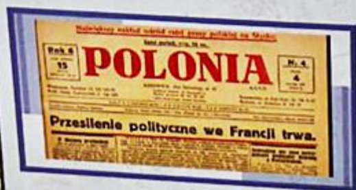
Clipping „Polonia”

W 1930 roku zjednoczył śląską chadecję z ogólnopolskim ugrupowaniem, a w 1931 roku został prezesem Zarządu Głównego Chrześcijańskiej Demokracji. Poświęcił się publicystyce, polemizował z sanacją, propagował katolicką naukę społeczną, piętnował państwa totalitarne. Odwoływał się do papieskich encyklik społecznych, krytykując liberalizm i kapitalizm.