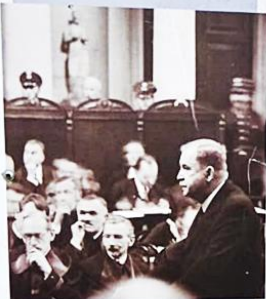
Władysław Korfanty podczas procesu brzeskiego - Żółty 1930