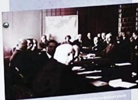
Władysław Korfanty w siedzibie Województwa Śląskiego na dzisiejszym miejscu - Żółty 1930

Przewrót majowy z 1926 roku nazwał zbrodnią i rok później władze sanacyjne odwołały Korfante go ze stanowisk gospodarczych. Atakowano go na łamach sanacyjnej prasy, postawiono przed sądem marszałkowskim, zarzucając działanie na szkodę państwa polskiego w Banku Śląskim. Jego głównym przeciwnikiem w województwie śląskim był wojewoda Michał Grażyński.