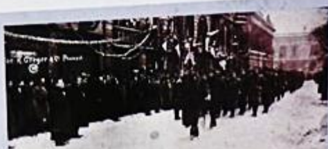
Wojciech Korfanty w Warszawie