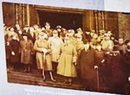
Wojciech Korfanty z delegacją w Katowicach Złota