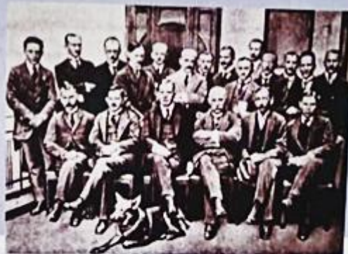
Polski Komisariat Plebiscytowy na Górnym Śląsku

Wojciech Korfanty wrócił do polityki w obliczu klęski Rzeszy pod koniec I wojny światowej. Wziął udział w uzupełniających wyborach do Reichstagu w czerwcu 1918 roku w okręgu gliwicko-lublinieckim i uzyskał mandat poselski. Otrzymał nawet poparcie ze strony niemieckiej. 25 października 1918 roku w wystąpieniu w Reichstagu domagał się przyłączenia do Polski „polskich powiatów Górnego Śląska”.