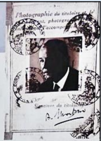
Francuski paszport Wojciecha Korfanteo