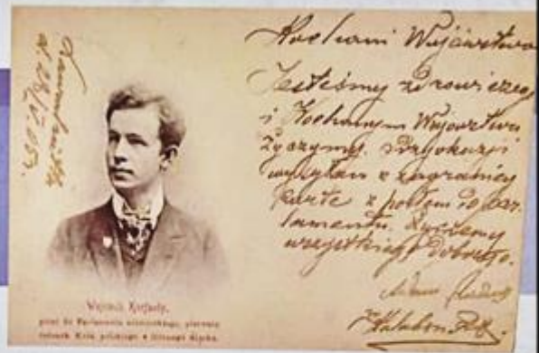
Wojciech Korfański jako poseł do Reichstagu

Wojciech Korfański w 1901 roku związał się na kilka lat z Ligą Narodową, w ramach której współpracował z Romanem Dmowskim. W tym samym roku rozpoczął pracę na stanowisku redaktora naczelnego „Górnoślązaka”. Za artykuł prasowy „Do Niemców” i „Do moich braci Górnoślązaków” skazano go na cztery miesiące więzienia. Karę odbywał wareszcie we Wronkach.