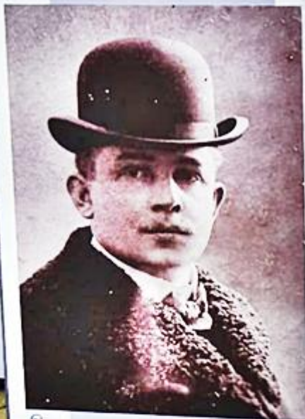
Wojciech Korfanty

Wojciech Korfanty urodził się w miejscowości Sadzawki w gminie Siemianowice. Na chrzcie otrzymał imię Adalbert. Miał czworo rodzeństwa. W 1879 roku rozpoczął naukę w ośmioletniej szkole ludowej w Siemianowicach, a w 1888 roku został przyjęty do gimnazjum męskiego w Katowicach. Jednak prawdopodobnie za utworzenie polskiego kółka samokształceniowego 14 sierpnia 1895 roku wydalono go ze szkoły, wskutek czego nie mógł przystąpić do matury. W 1896 roku przypuszczalnie zdał maturę w Gimnazjum św. Elżbiety we Wrocławiu. Następnie rozpoczął studia na Uniwersytecie Fryderyka Wilhelma w tym mieście. Rok później przerwał naukę, którą ponowił na przełomie lat 1899 i 1900. W 1901 roku przeniósł się na Uniwersytet Fryderyka Wilhelma w Berlinie, ale studiów nie ukończył.