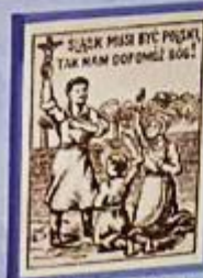
Wojciech Korfanty z polskimi plebiscytami