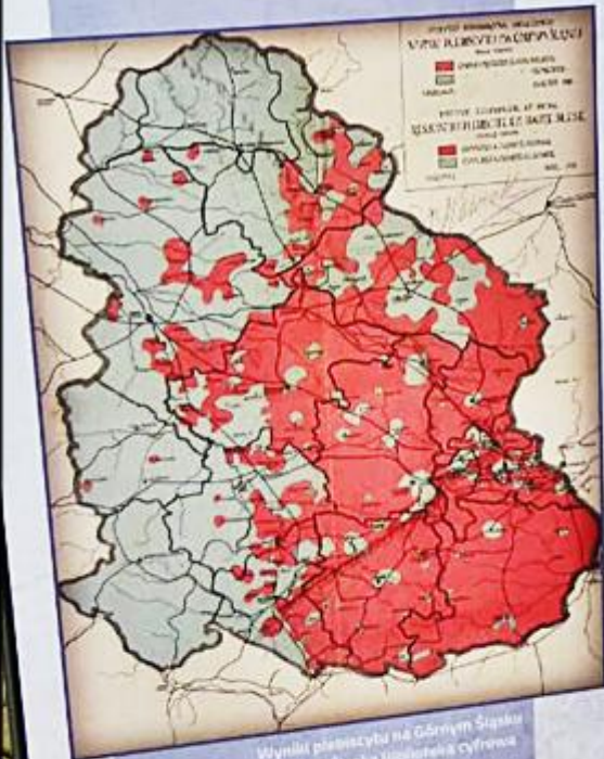
Wyniki plebiscytu na Górnym Śląsku