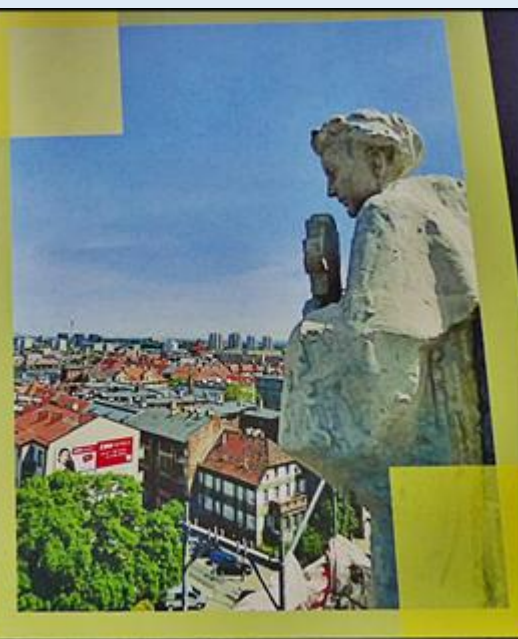
Widok z tarasu