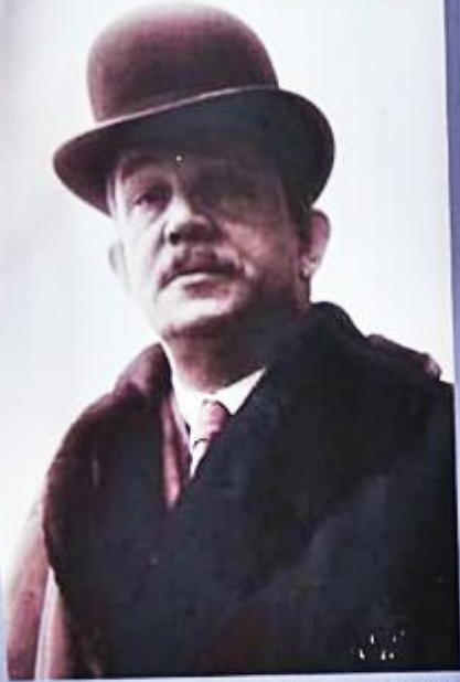
Wojciech Korfanty