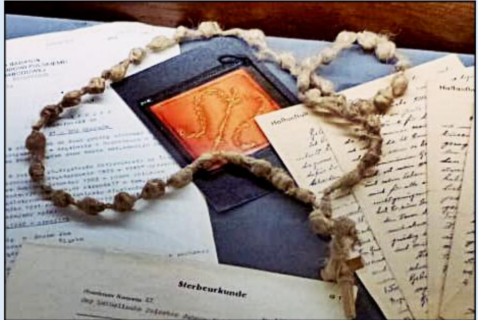
Różaniec wykonany ze sznurka w więzieniu przed wykonaniem wyroku