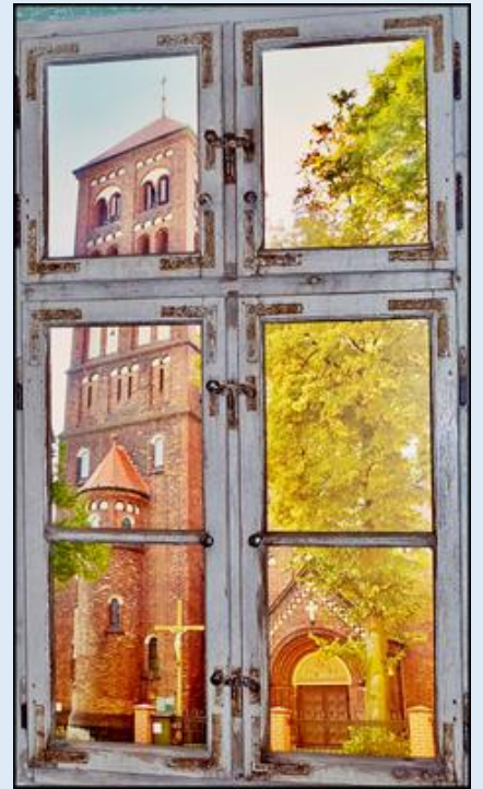
Chorzów Stary - Kościół pw. św. Marii Magdaleny