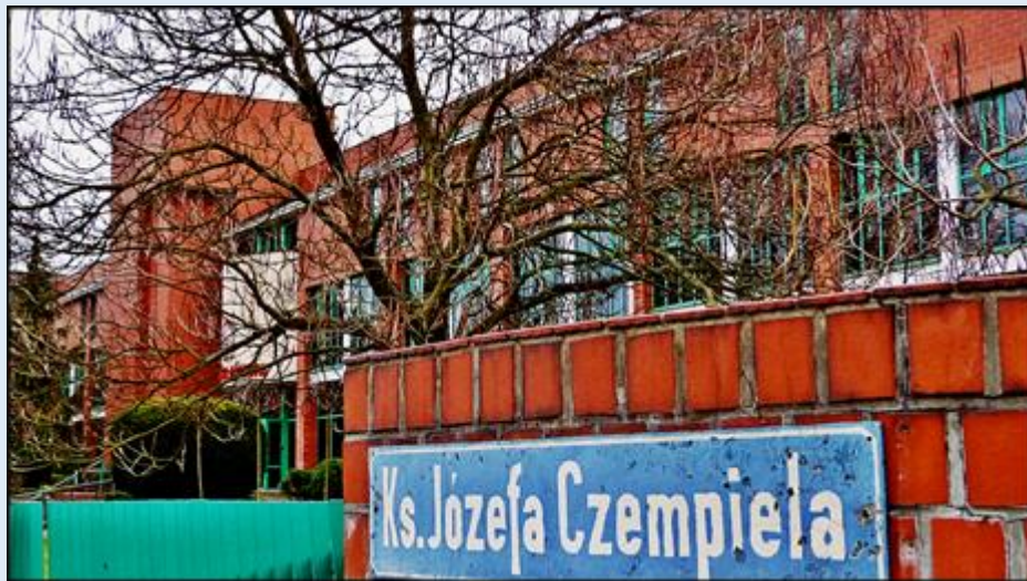
Józef Czempiel, bł.