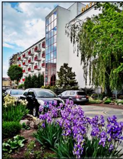
Dębowa Aleja Artystów