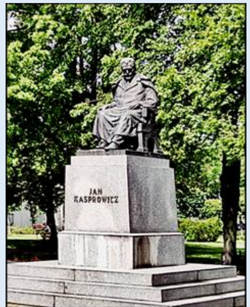
Pomnik Jana Kasprowicza