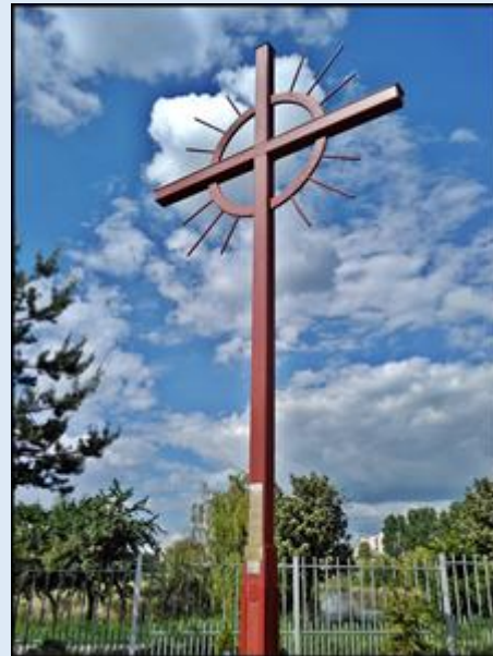
Instytut Prymasa Józefa Glempa