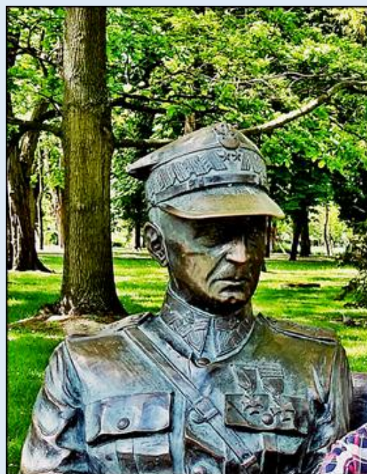
Ławeczka gen. Władysława Sikorskiego