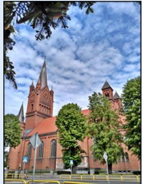
Zob. kościóły Inowrocławia