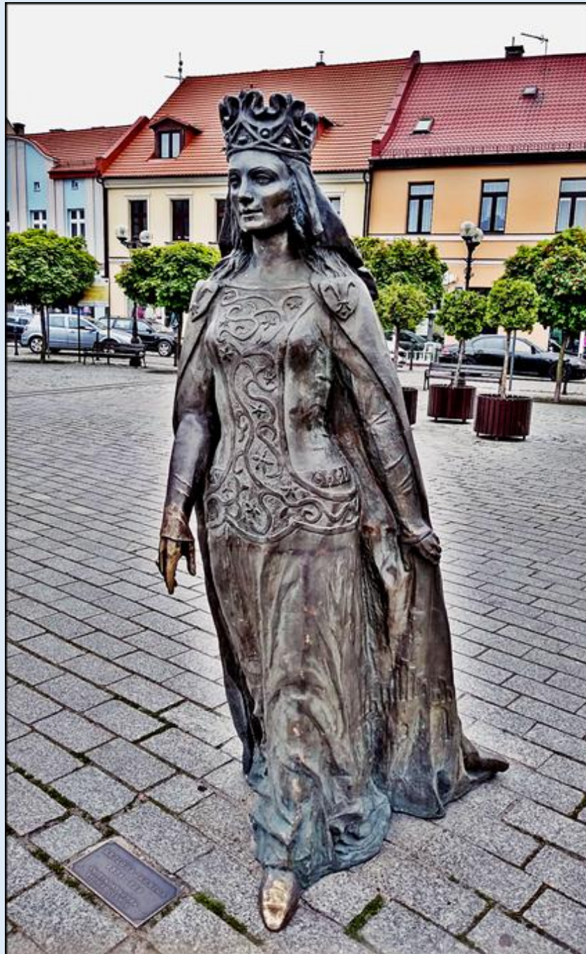
Pomnik św. Jadwigi na Rynku Miejskim