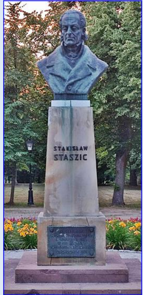
zob. Pomnik Stanisława Staszica