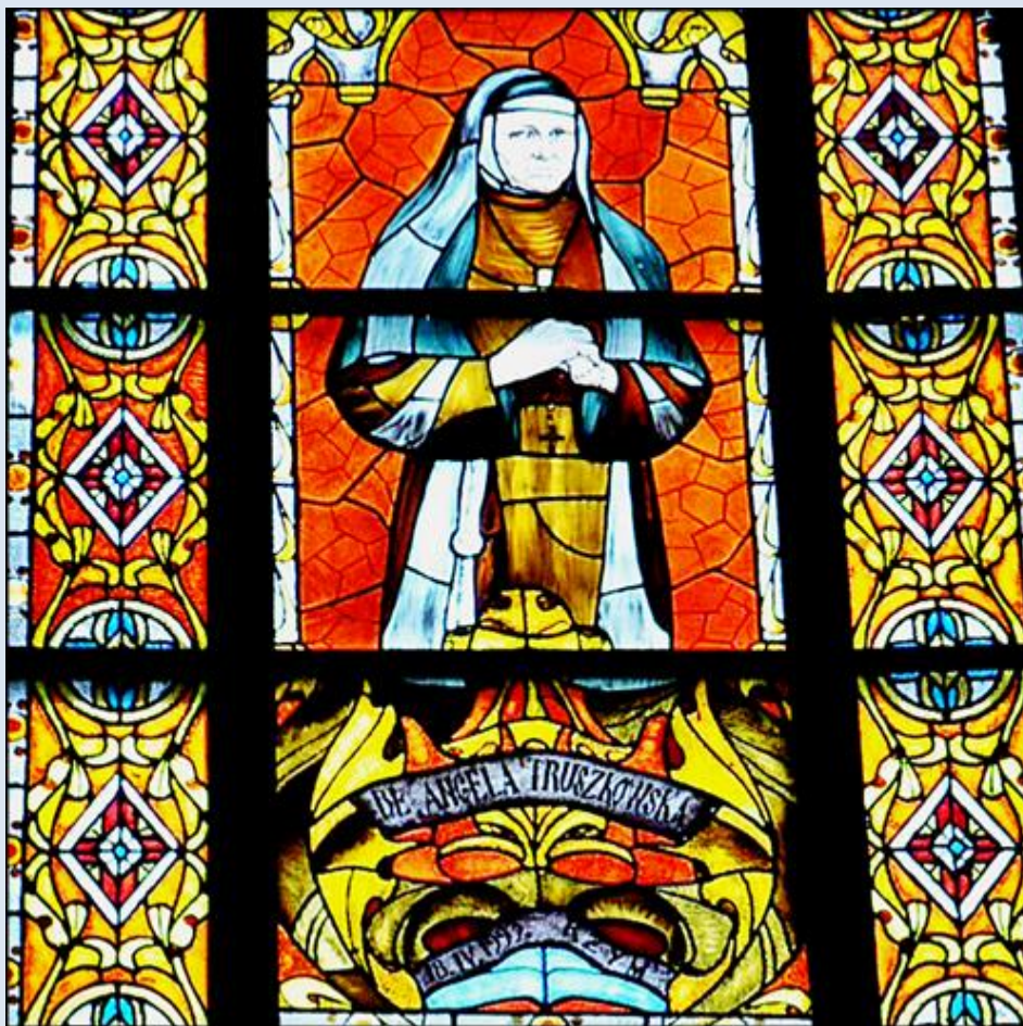
Warszawa, witraż w Kościele pw. śś. Apostołów Piotra i Pawła

http://www.felicjanki.pl/bl-maria-angela/