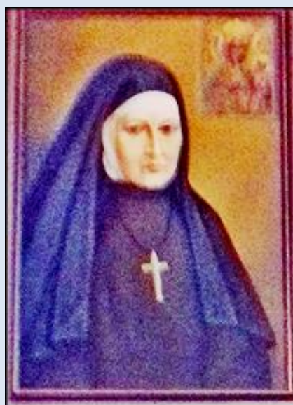
M63,7- Warszawa, fk w ko św. Stanisława bpa; Warszawa-Marysin Wawerski, ko. św. Feliksa z Kantalicjo