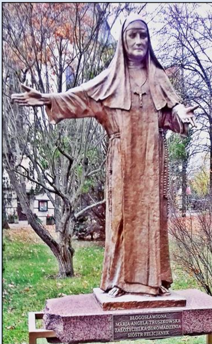
Warszawa-Marysin Wawerski, ko. św. Feliksa z Kantalicjo