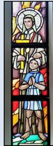
3. Portugalia – Fatima, galeria przy ko Trójcy Przenajśw.; P1860572- 7.VII.'12; 4. Dobryczyce, wt w ko św. Bartłomieja; 5. Kąclowa, MAŁ, wt w ko WNMP;