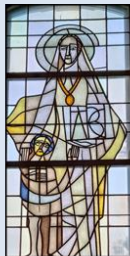
M11,9 – Tylicz, MAŁ, pł. w ko Najśw. Imienia Maryi; M11,10 – Łódź, wt w ko św. Alberta Chmiel.; Strzelce Opolskie, Ko. św. Wawrzyńca (zdz. pw)