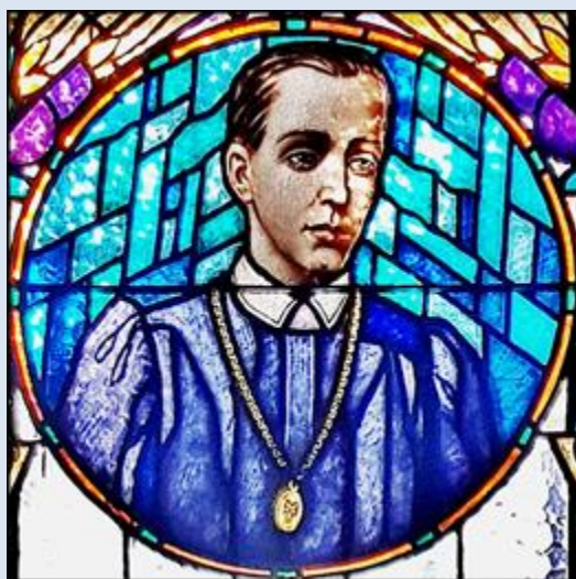
Siemianowice Śląskie, ko. św. Antoniego (zdz. pw)

Jeżeli nie zaznaczono inaczej, to zdjęcia: Jan Nitecki